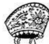
Кокошник. Московская губерния