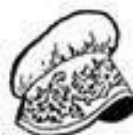
Кокошник. Орловская губерния