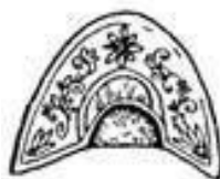
Кокошник. Владимирская губерния