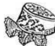
Кокошник. Олонецкая губерния