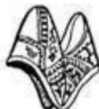
Кокошник. Курская губерния