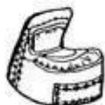
Кокошник. Курская губерния