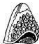
Кокошник. Псковская губерния