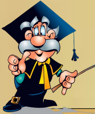
Схема предложения строится следующим образом: