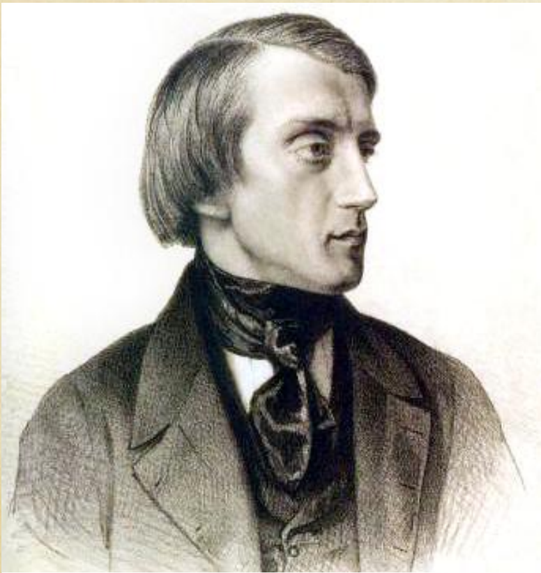
Виссарион Белинский (1811–1848 гг.)