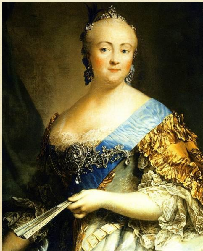
Елизавета Петровна (1709–1761 гг.)