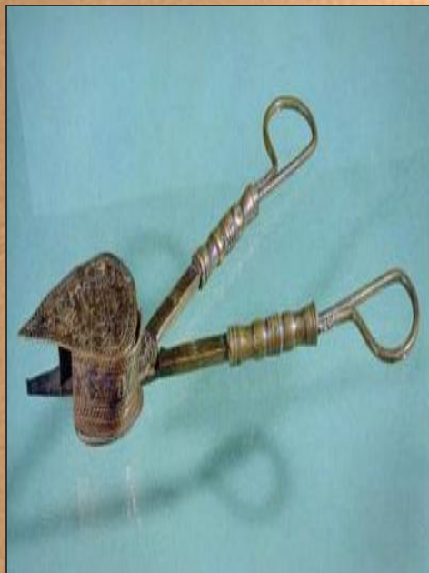
Ножницы для свечей. Италия. 16 в.