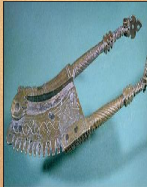
Ножницы для срезания плодов. Индия. 18 в.