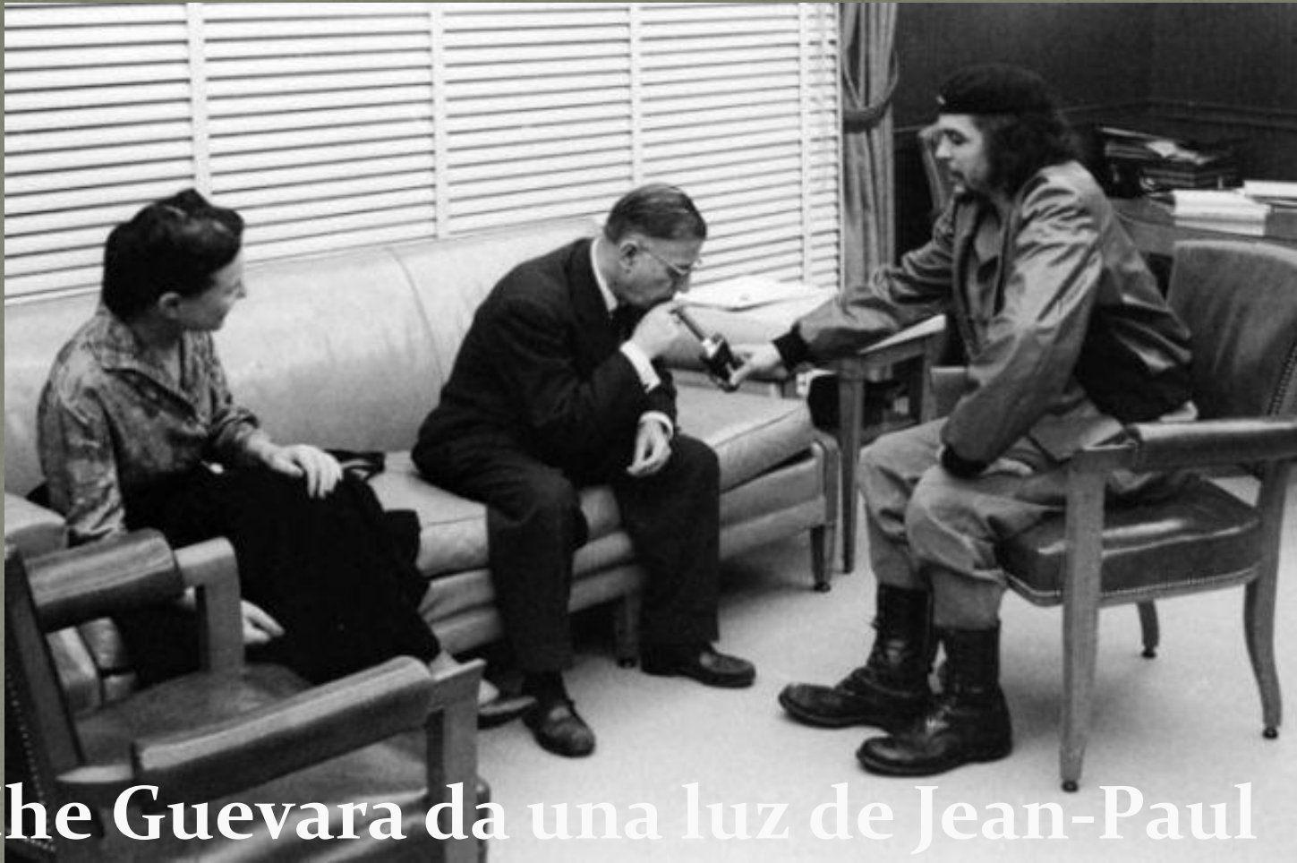
Che Guevara da una luz de Jean-Paul Sartre. A la izquierda se encuentra la escritora francesa Simone de Beauvoir. Cuba, 1960