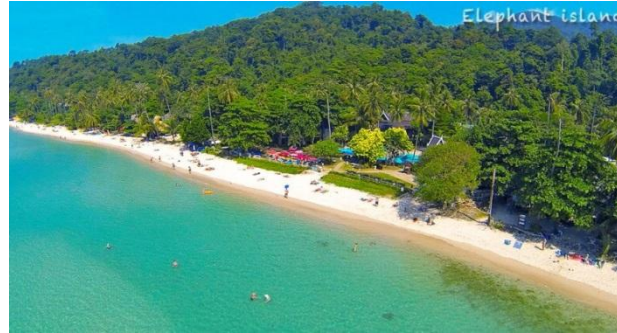
Лонли Бич (Джунгли и горы в этой части острова почти вплотную подходят к береговой)