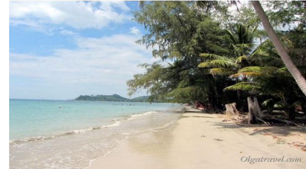
Клонг Прао (придется или довольствоваться инфраструктурой отелей, или арендовать байк)