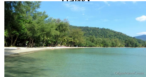
Чай Чет (идеально подойдет для отдыха с детьми)