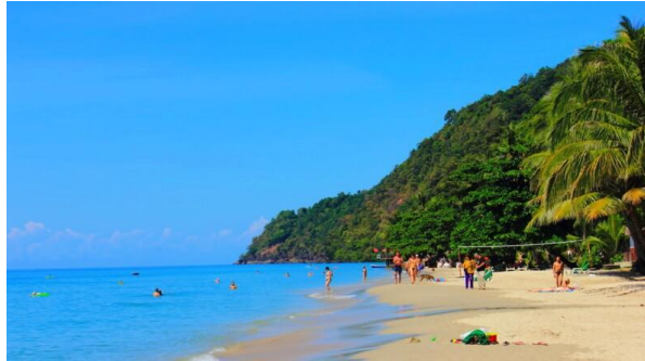
Вайт Сенд Бич (самый известный, самый шумный, самый популярный)