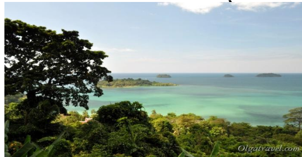
Кай Бей (золотая середина между шумным Вайт Сенд и тихим Клонг Прао)