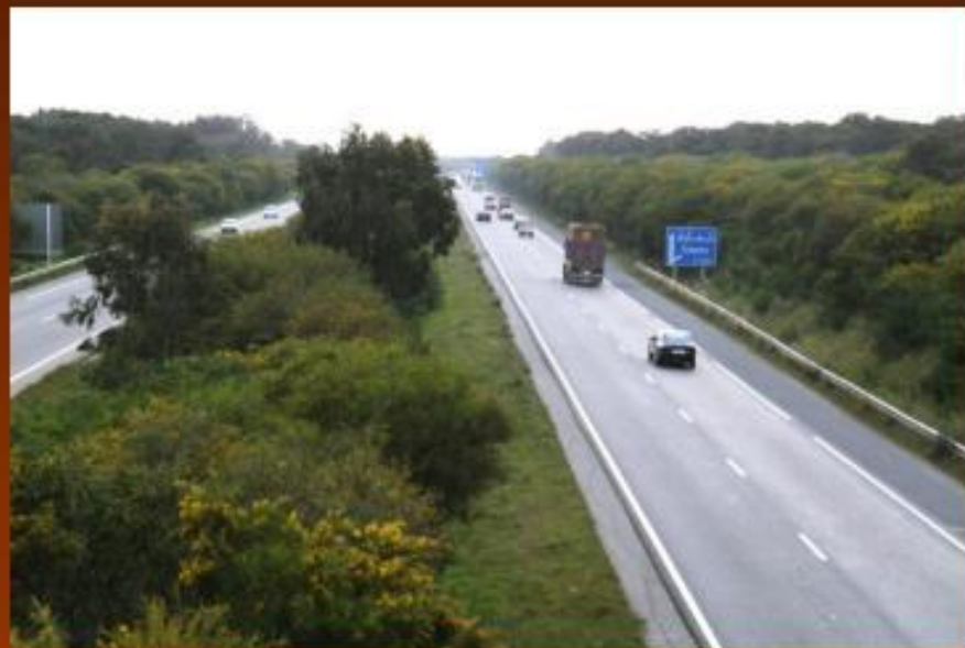
Автодорога А3 Касабланка — Рабат в Марокко