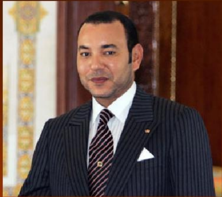
Король Мухаммед VI