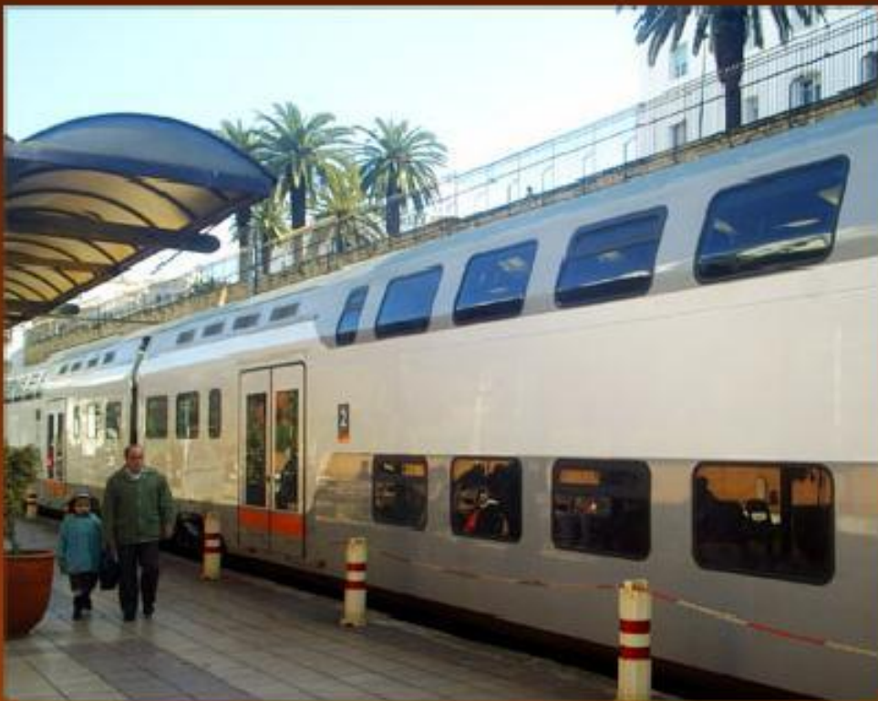
Двухэтажный вагон поезда на одной из станций в Марокко