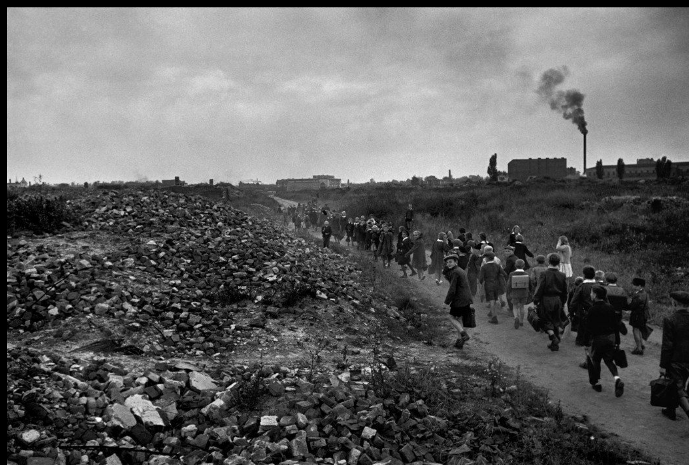
Греция 1947 год. Детей, потерявших во время войны кров и близких, эвакуируют с островов на материк.