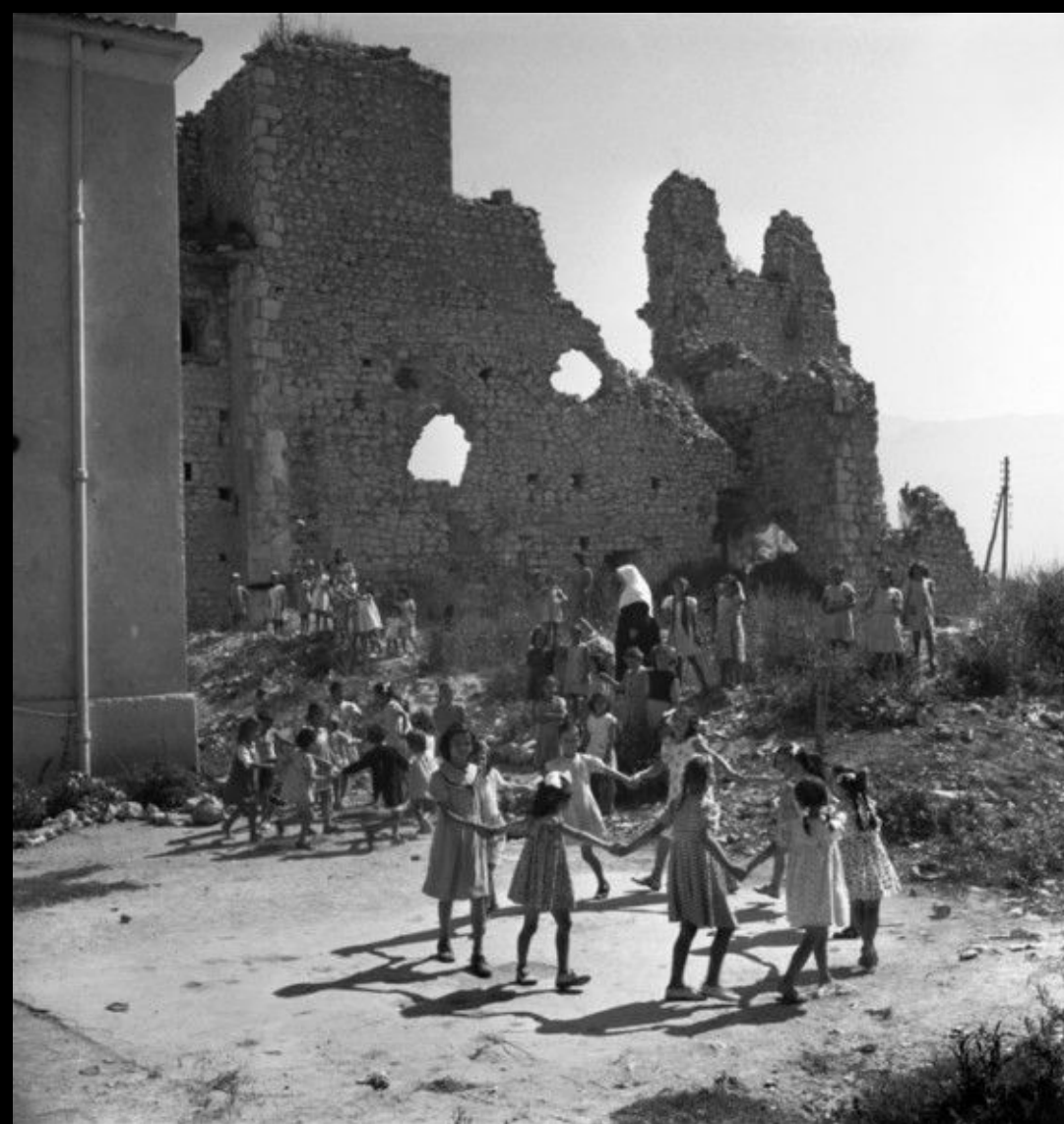
Девочки-сироты играют среди развалин своего бывшего приюта. Лаций, Италия. Монте-Кассино, 1948 Год