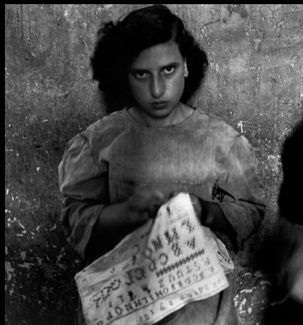
Девушка, которую изнасиловали во время войны, в исправительной колонии Альберго деи Повери училась вышивать. Неаполь, Италия, 1948 Год.