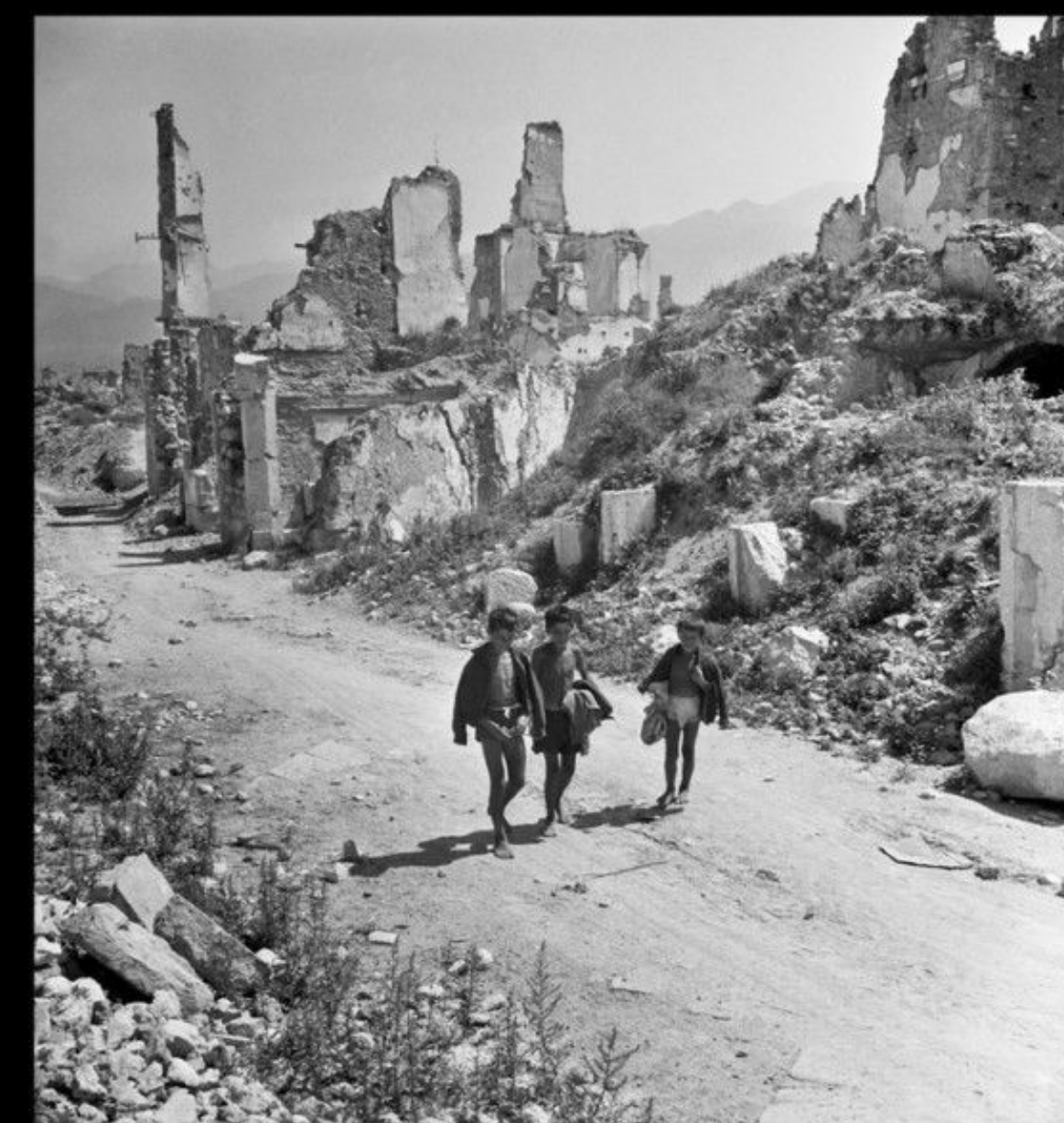
Дети гуляют по развалинам Монте-Кассино. Лаций, Италия. 1948 Год