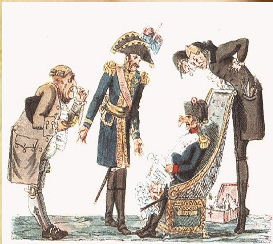
Карикатура И.И. Теребенева.

Наполеон: Вот какой нос приставили мне русские! Не знаю, как мне с ним показаться парижской публике! Нет ли средств укоротить его?