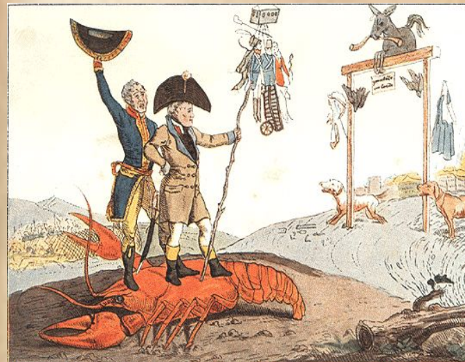
Триумфальное прибытие в Париж Наполеона. Карикатура Венецианова.

оставив глубокий след почти во всех сферах русской жизни начала XIX столетия, оказала благотворное влияние и на развитие русского искусства. Бесспорным считается тот факт, что эта война пробудила любовь к родине, к народу, ко всему родному. Если до двенадцатого года, по удачному выражению историка, все русские хотели казаться французами, то после Отечественной войны они так же сильно хотели быть русскими. Вот это-то желание стать русскими проявилось и у наших художников той эпохи.