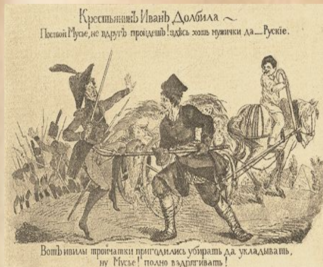
А. Г. Венецианов

В России, только начиная с 1812 года, начинается непрерывное развитие карикатуры. Это развитие не могло быть уже ничем остановлено, и русская карикатура стала приобретать все большее и большее политическое значение. Именно благодаря карикатуре эпохи Отечественной войны русское общество стало ценить и понимать этот род живописи, и с того времени карикатура стала одним из факторов общественной жизни в России. Вот в чем прежде всего заключается значение карикатур рассматриваемой эпохи.