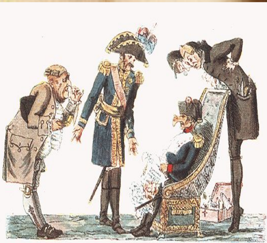
Карикатура И.И. Теребенева.

Наполеон: Вот какой нос приставили мне русские! Не знаю, как мне с ним показаться парижской публике! Нет ли средств укоротить его?