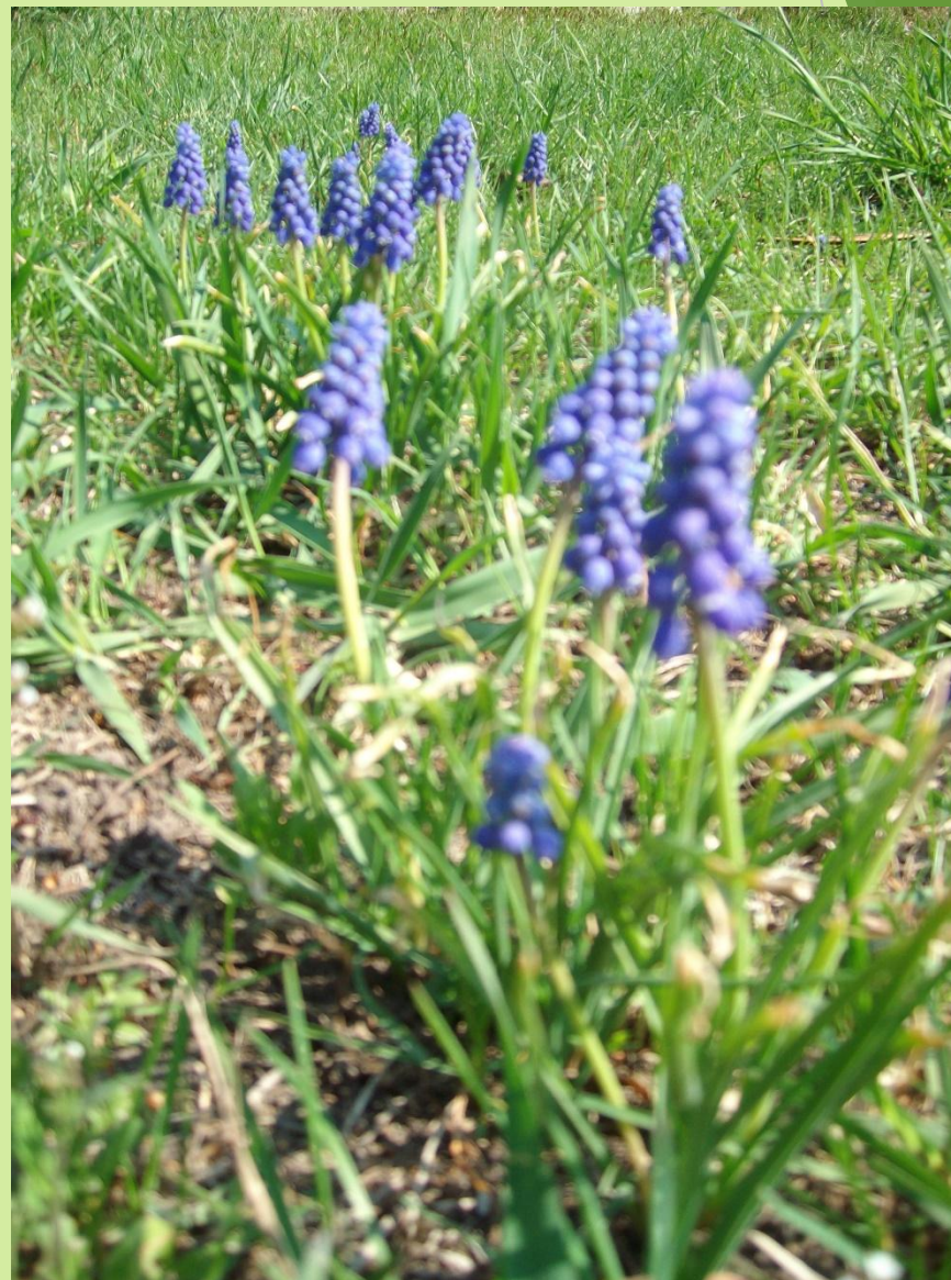
Фото № 1. как называется растение? Культурное оно или дикорос? И является ли оно лекарственным?