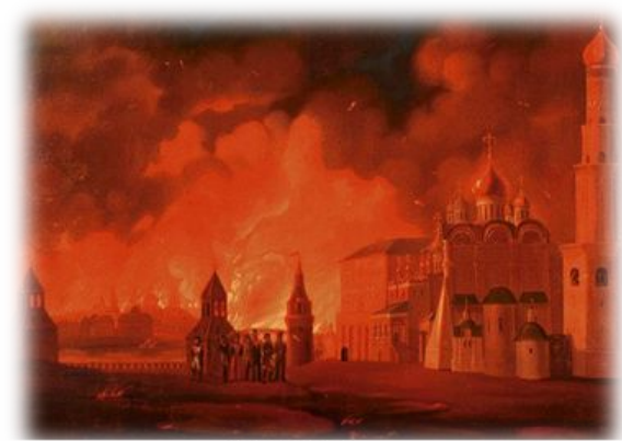
Мурман Рнв 1812