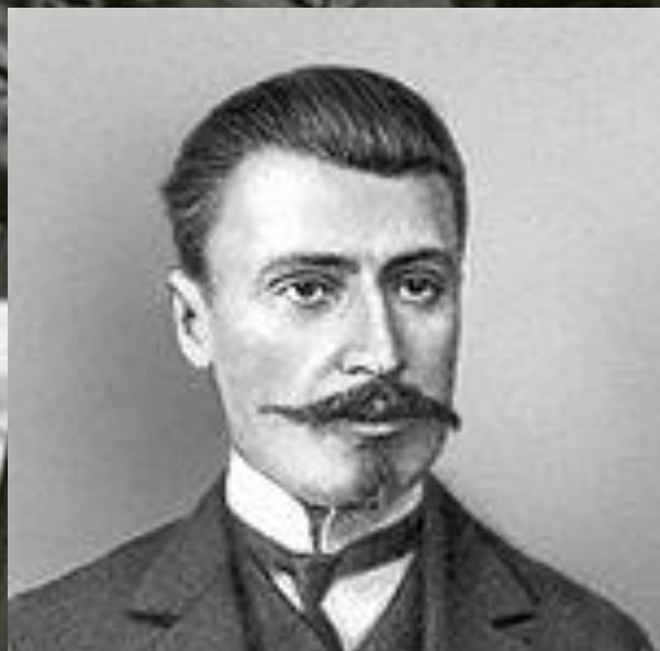
Церетели Ираклий Георгиевич