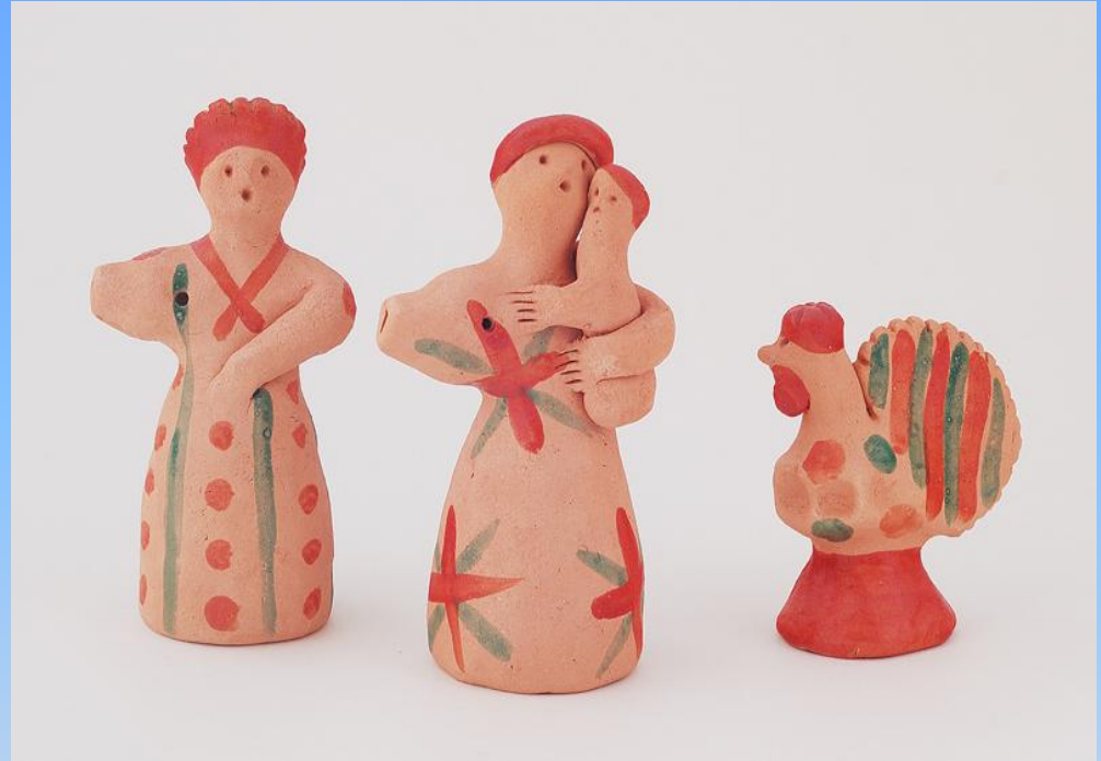
Колокольчики в традициях плешковской игрушки Автор Н. Фролова. Коллекция О.Поповой