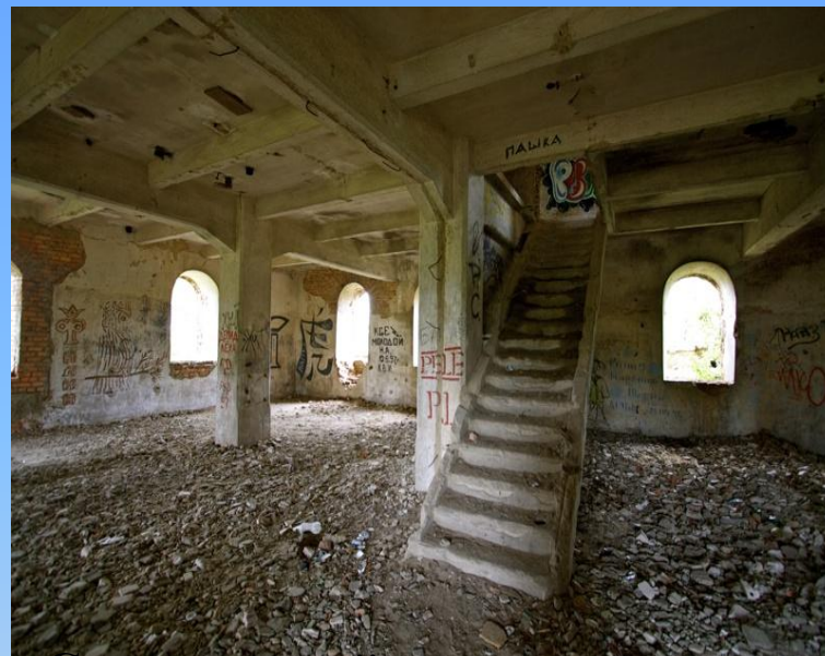
Сохранившийся цех мельницы.