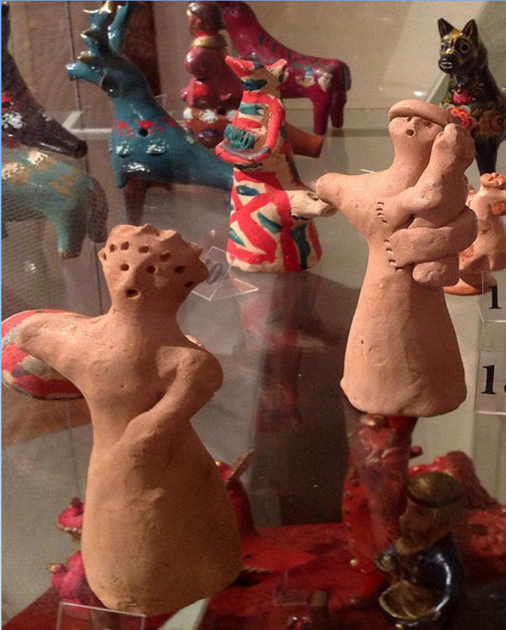
Плешковские игрушки "Куколка « и "Баба с ребёнком". 1990-е