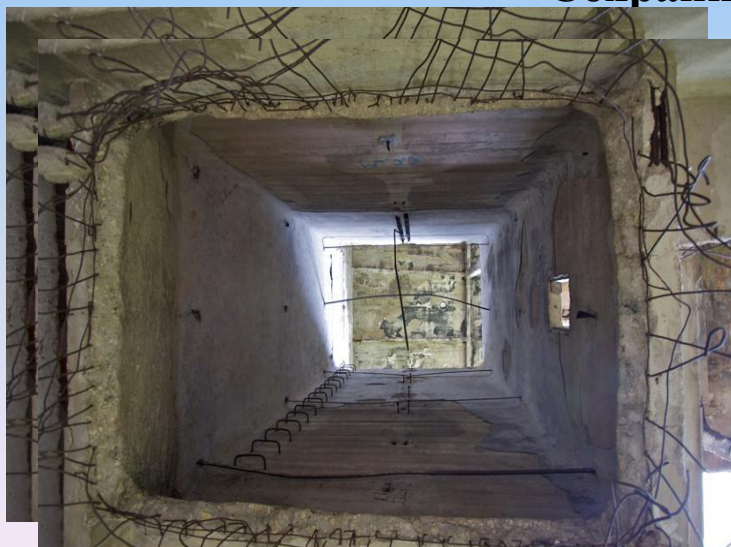
Один из элеваторов, где раньше хранилось зерно.