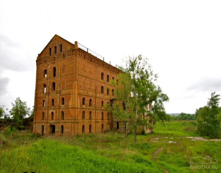
Мельница купца Адамова. Год постройки 1873.