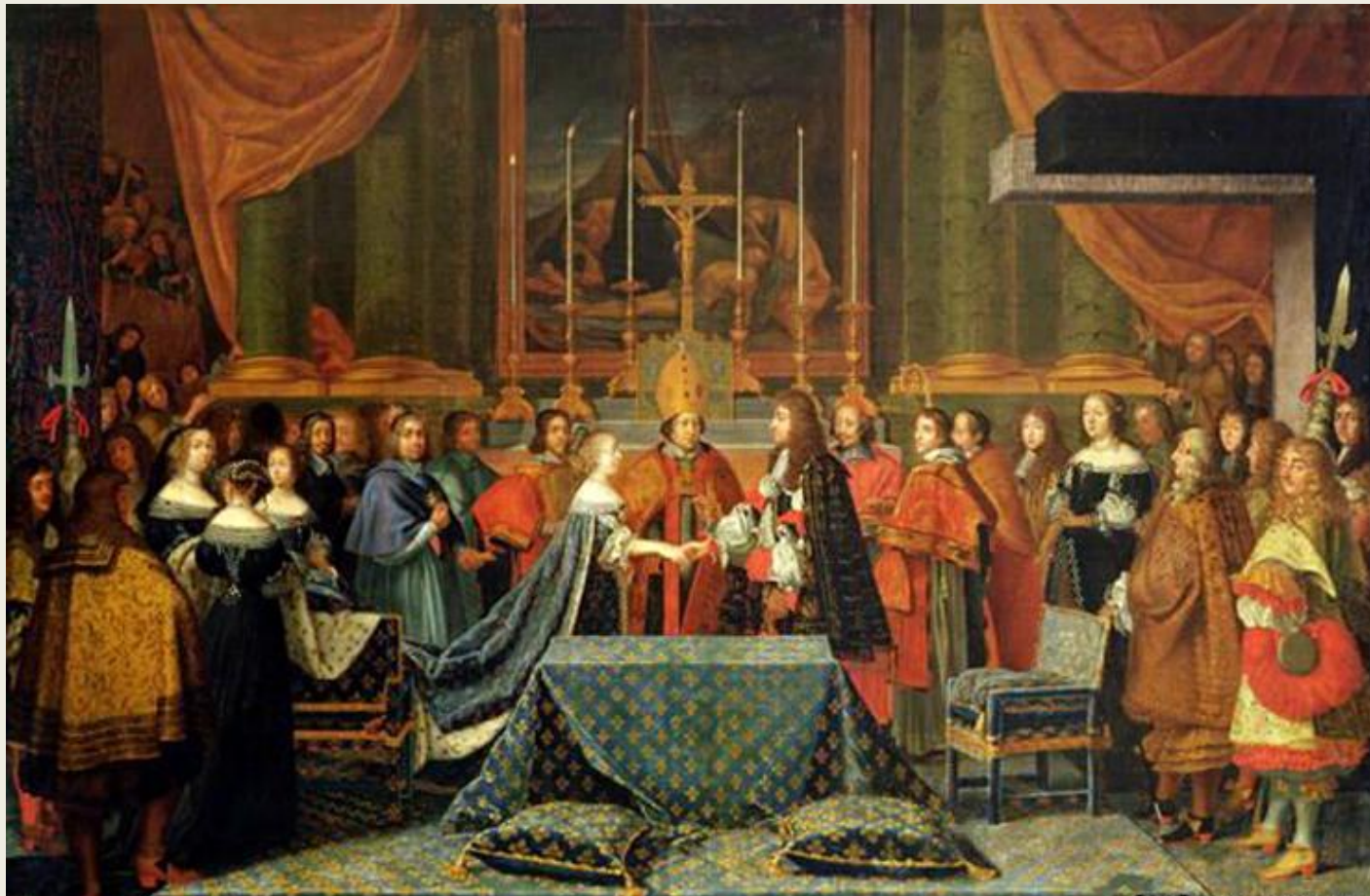
Свадьба Людовика XIV и Марии - Терезии.