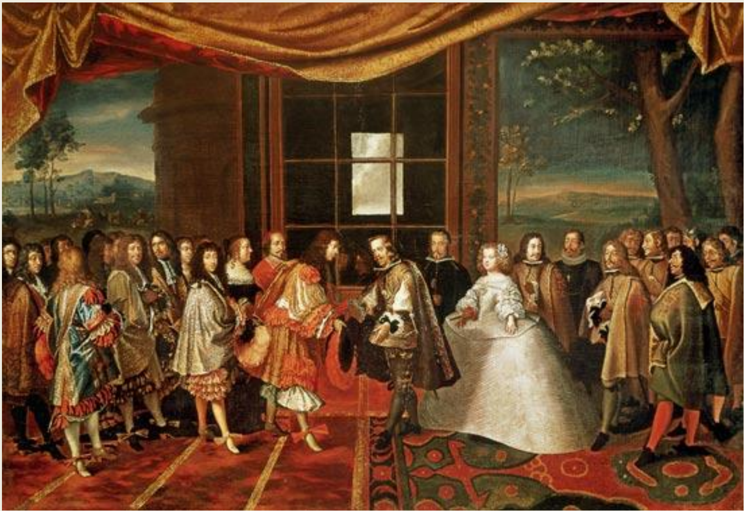
Встреча Людовика XIV с Филиппом IV.

Французские аристократы подражали своему правителю.