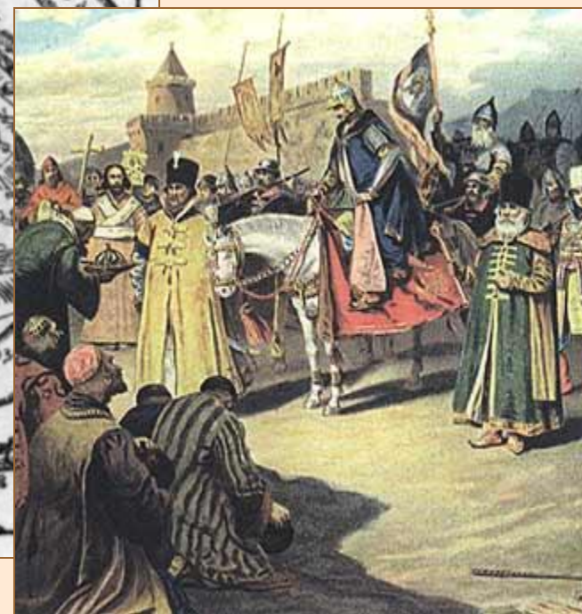
Казанский кремль в 1568 г.