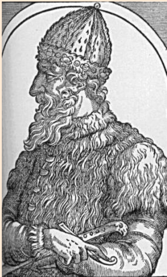
Иван III 1440 - 1505