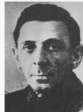
Начальник Орловского сыскного отделения полиции 15 апреля 1942 — 24 июля 1943