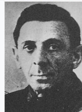
Начальник Орловского сыскного отделения полиции 15 апреля 1942 — 24 июля 1943