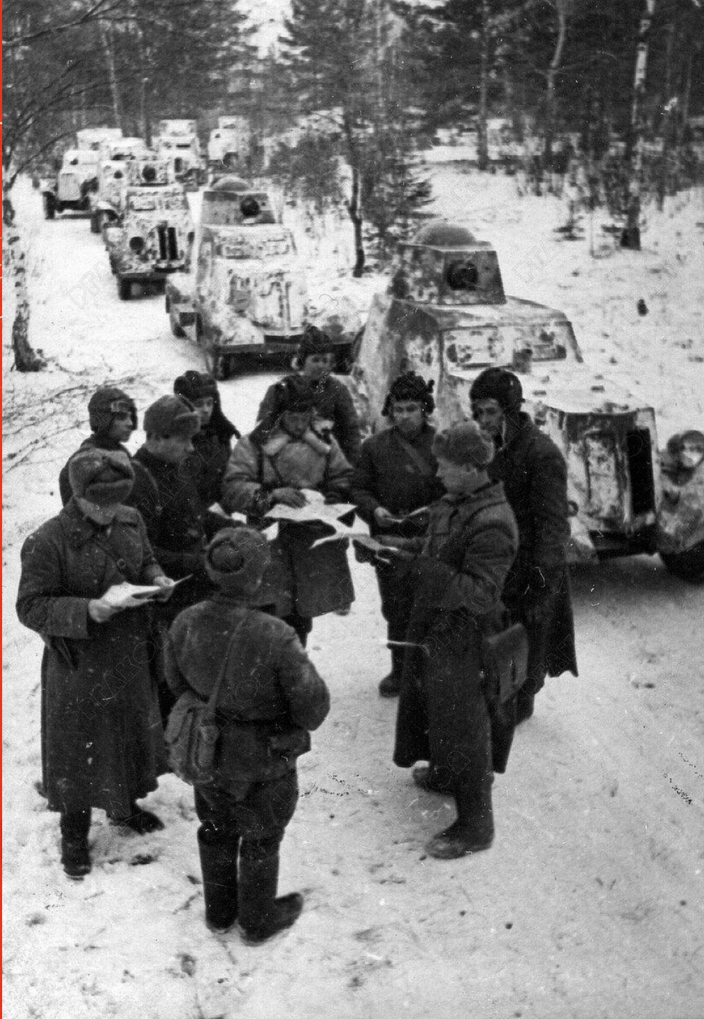
Колонна бронемашин выступает на боевые позиции в районе Можайска. Московская обл. СССР. Декабрь 1941