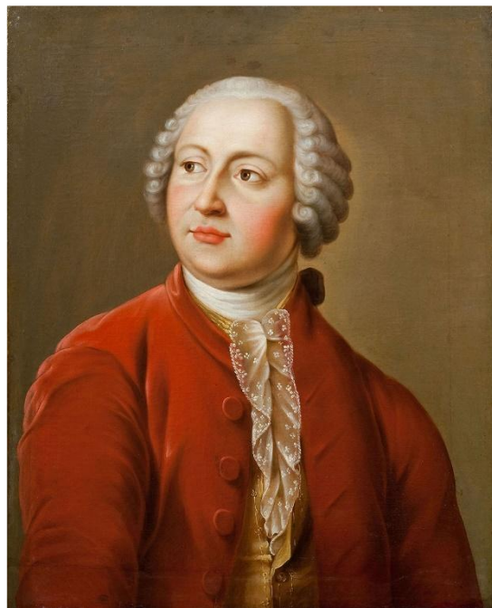
Ломоносов Михаил Васильевич