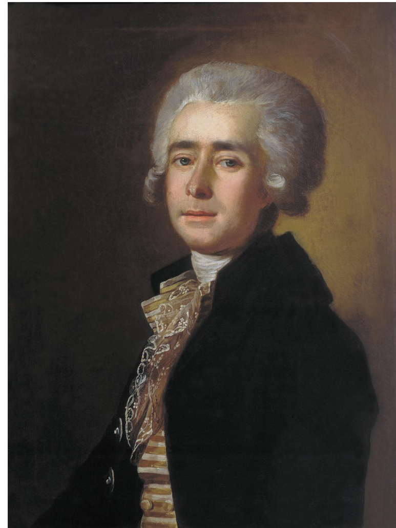
Дмитрий Степанович Бортнянский