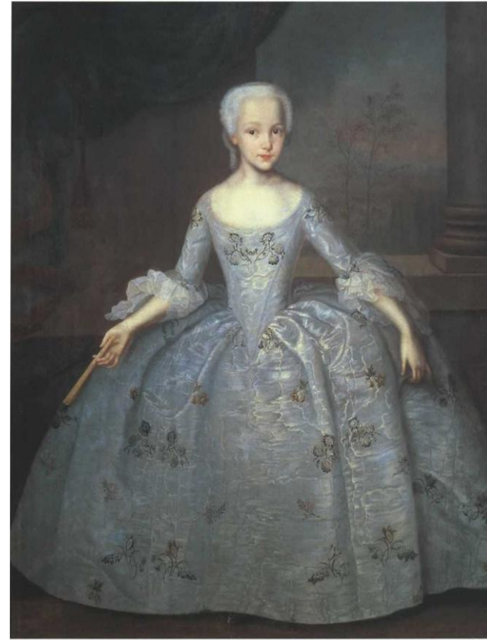
Иван Вишняков. Портрет Сарры Элеоноры Фермор. Около 1750.