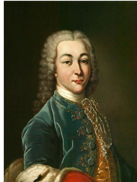
Кантемир Антиох Дмитриевич