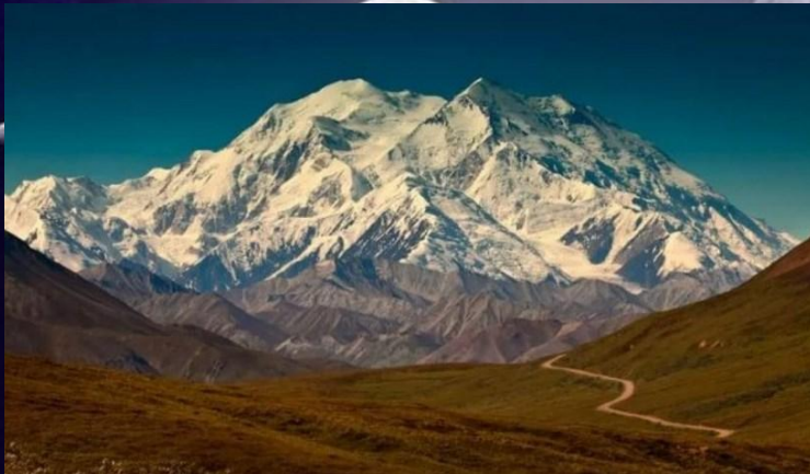
Гора Мак-Кинли (Денали)

Самая высокая точка северной части Американского материка находится на Аляске — Мак-Кинли (6190 метров над уровнем моря), эта гора в 2015 году была переименована в Денали, что на языке местных индейцев обозначает «большой». Среди семи самых высоких гор семи континентов она занимает третье место после Эвереста в Гималаях и Аконкагуа в Южной Америке. Высота от подножия к вершине составляет 5500 метров, Эверест же