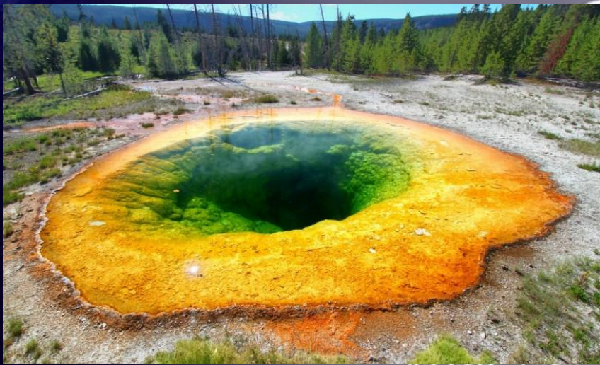
Вулкан в Йеллоустоуне

Территория Северной Америки на треть покрыта лесами, здесь есть более 50 национальных парков, самые большие из них размещены на территории США — Йосемитский и Йеллоустоунский.