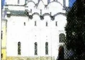
Софийский собор в Новгороде

Республика – форма государственного управления, при которой верховная власть принадлежит избранному населением представителям.