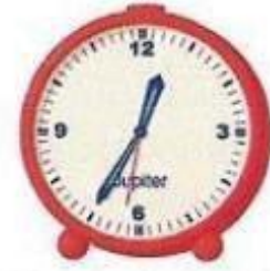
fünf nach halb eins