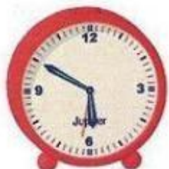
zehn vor sechs