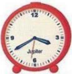
20 vor vier