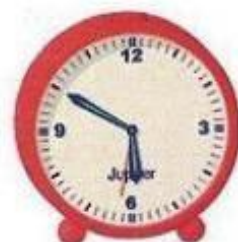
zehn vor sechs