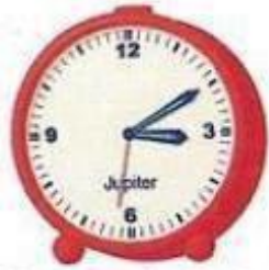
zehn nach drei