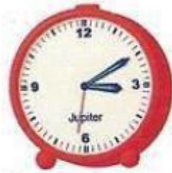
zehn nach drei