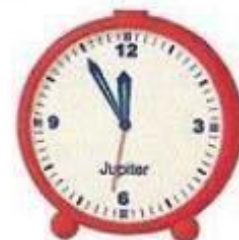
fünf vor zwölf