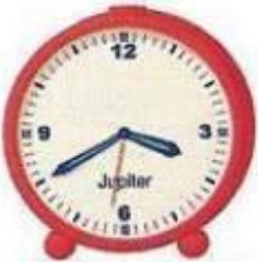
20 vor vier