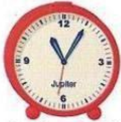
fünf nach elf