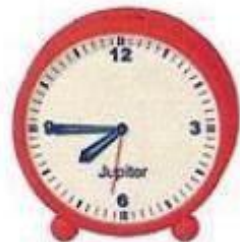
Viertel vor acht