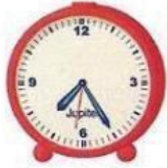
fünf vor halb acht