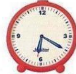
20 nach sechs