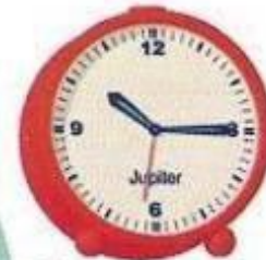
Viertel nach zehn