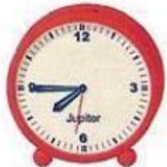
Viertel vor acht