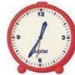
fünf nach halb eins