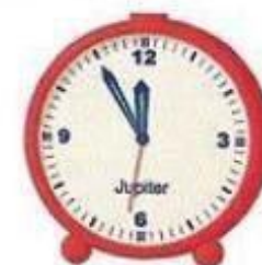
fünf vor zwölf