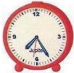
fünf vor halb acht