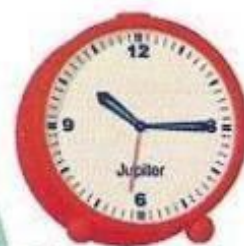
Viertel nach zehn