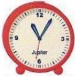
fünf nach elf