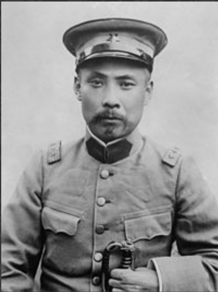
Китайский генерал Дуань Цижуй

Япония имела большое влияние на китайского генерала Дуань Цижую, который после смерти Юань Шикая в июне 1916 г. стал премьер-министром Китая. Добиваясь положения полновластного хозяина Китая, генерал сделал ставку на японцев, постепенно сам превращаясь в их ставленника. 1918 г. японцы оказали ему крупную финансовую помощь, передав 145 млн. иен — так называемые "займы Нисихары".