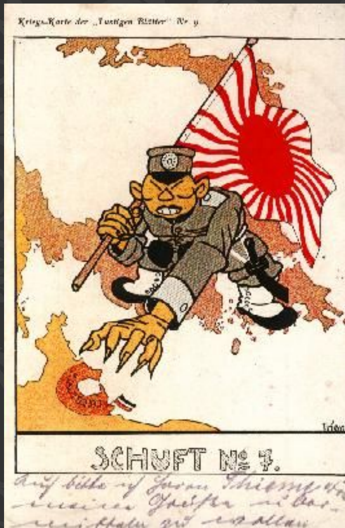
Немецкая открытка времен Первой мировой войны

Официальная пропаганда тут же подыскала убедительные доводы в пользу такого решения. В Токио стали ссылаться на верность духу японо-английского союза.