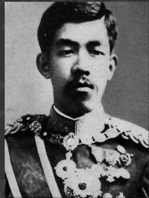
Император Иошихито Харукомийа

Результаты войны в 1914 году для Японии были достаточно удачны: занятие ряда островов севернее экватора, важного плацдарма в Китае, широкое военное присутствие на Тихом океане. И всё это при очень ограниченном использовании своих военных сил. Однако, до политического признания этих завоеваний было еще далеко. После занятия Циндао, которое, по договоренности, Япония обещала передать за плату Китаю, возникли трения с Великобританией, т.к. выполнять свои обещания Япония не собиралась. Австралия и Новая Зеландия были крайне не довольны занятием Японией островов в Тихом океане.