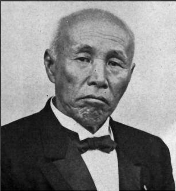
Премьер-министр Граф Окума