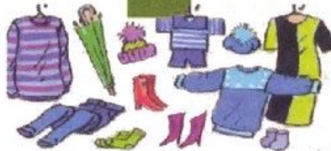
Товары и услуги