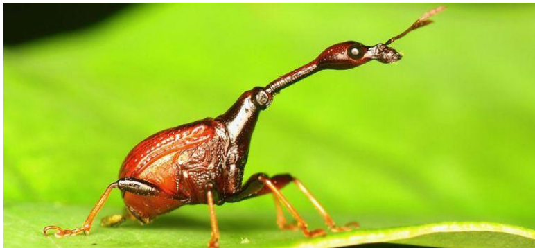
насекомое Долгоносик - жираф