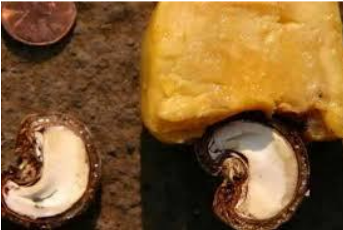
Орежи - кешью