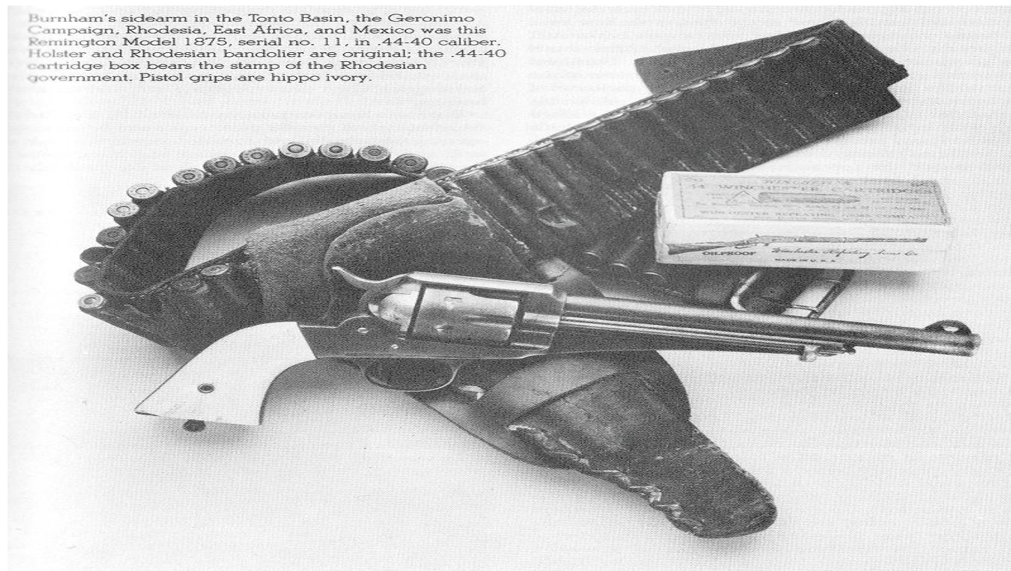
Патронташ, кобура и револьвер , 1912 год