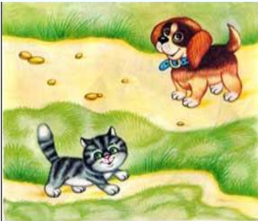
Дорожка широкая и узкая