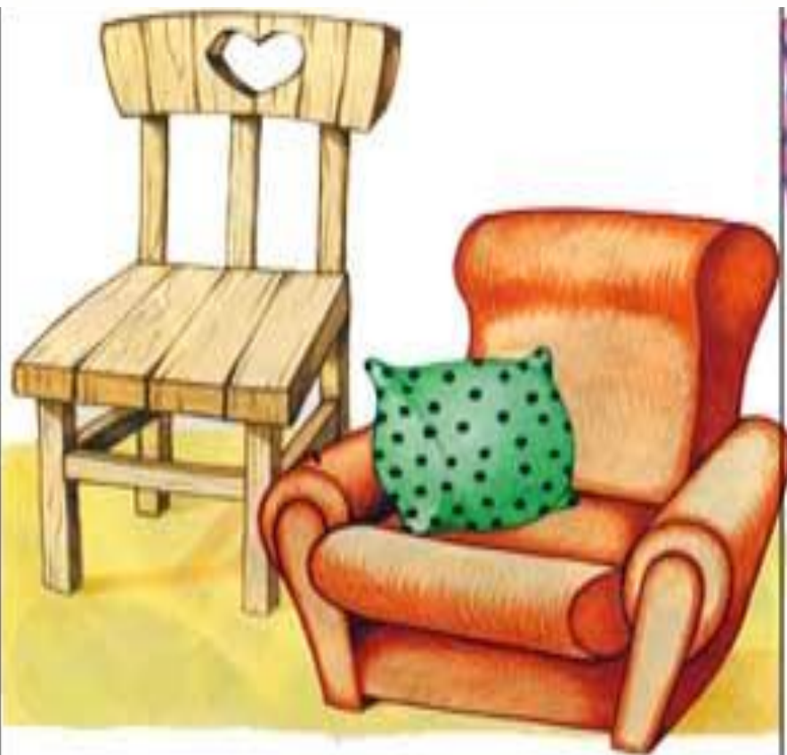
Твердый и мягкий