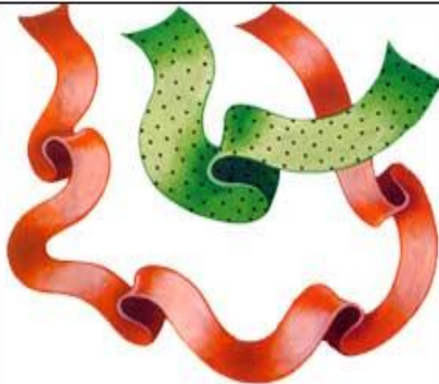
Длинная и короткая ленточка