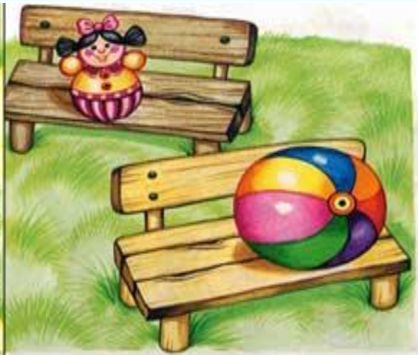
Скамейка широкая и узкая