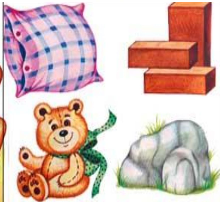
Твердый и мягкий