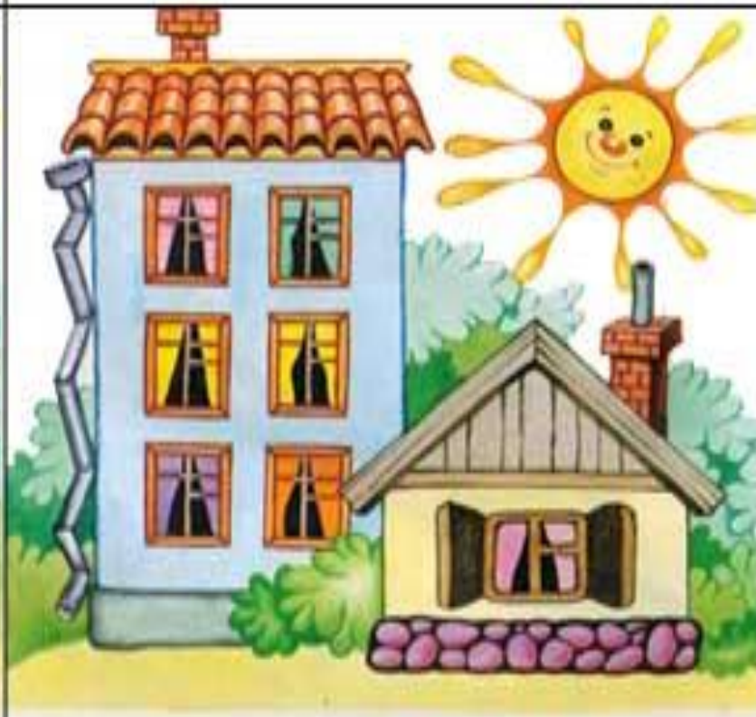
Высокий и низкий