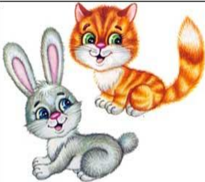
Ушки и хвостик длинные и короткие