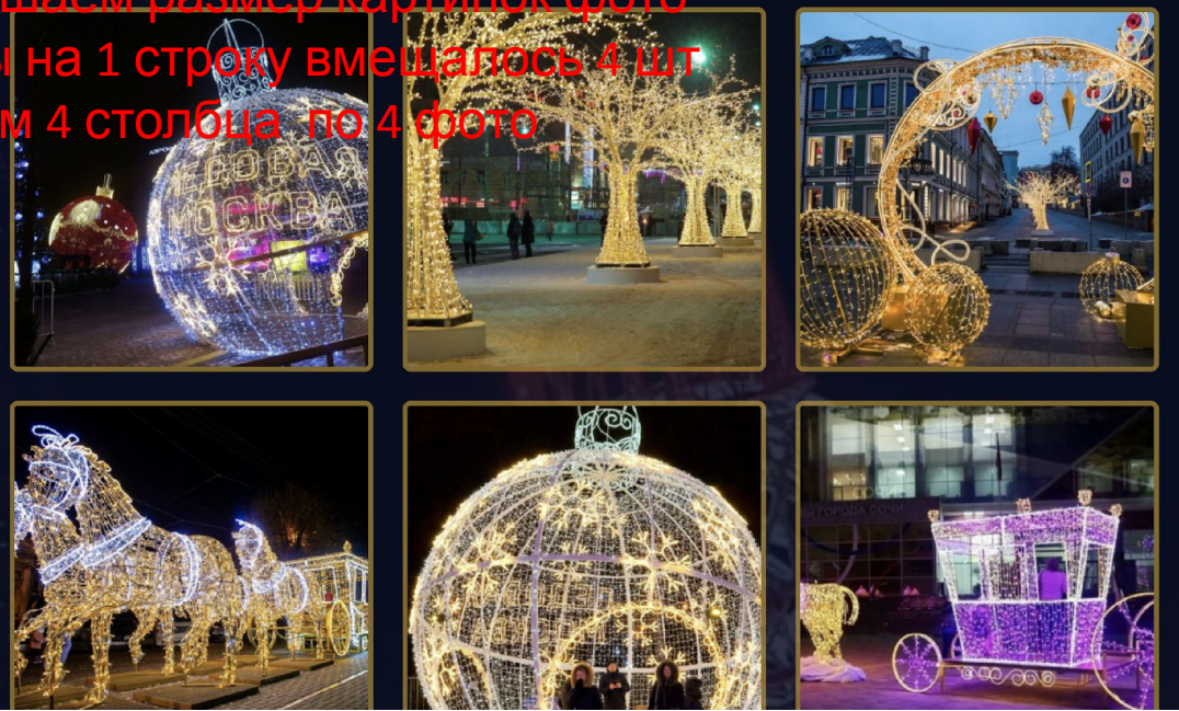
Фото изменили это хорошо дублирующиеся картинки Нужно убрать