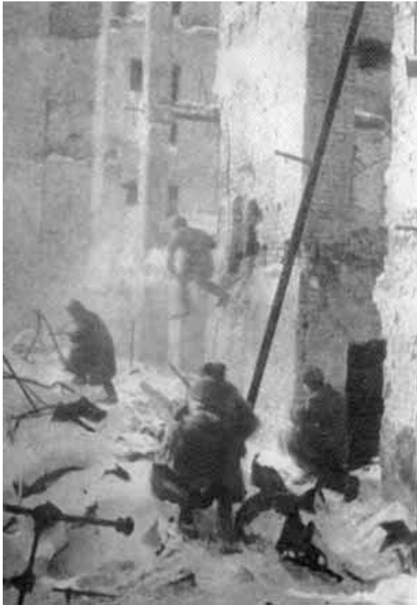
Уличные бои в Сталинграде