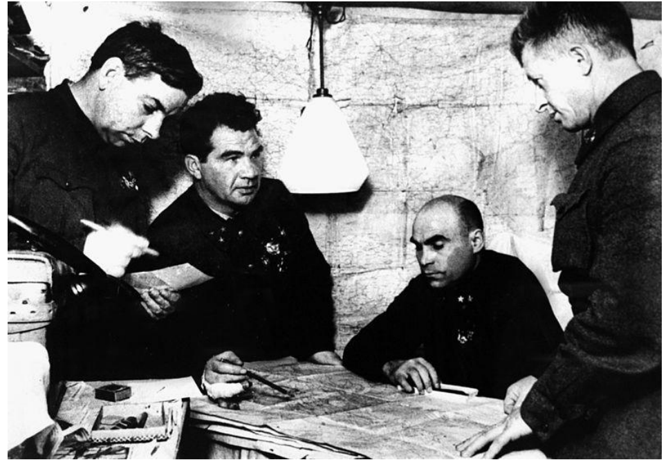
Командный пункт 62-й армии: начальник штаба армии Н. И. Крылов, командующий армией В. И. Чуйков, член Военного совета К. А. Гуров, командир 13-й гв. сд А. И. Родимцев, декабрь 1942.