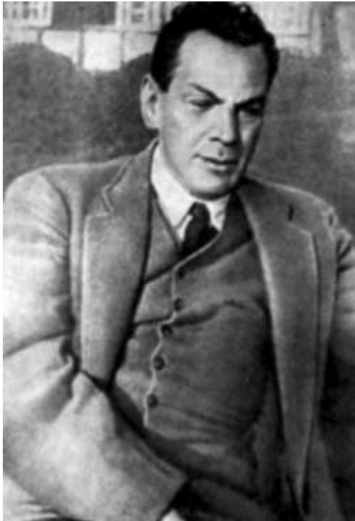
Рихард Зорге (Рамзай)