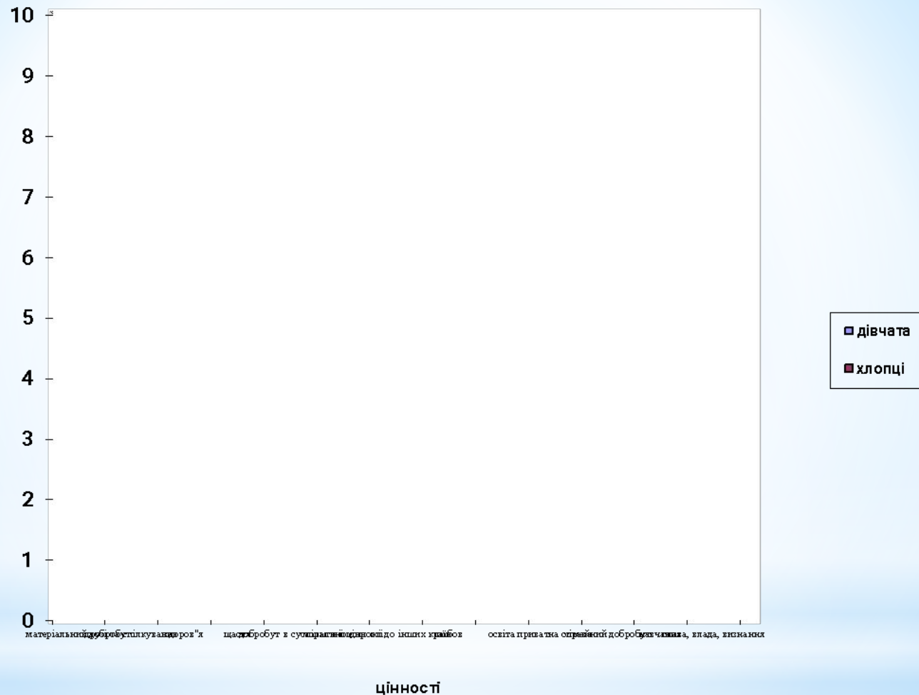
Рис. 2.4. Особливості сформованості ціннісної сфери підлітків за методикою «13 найбільших бажань» (порівняння між хлопцями та дівчатами 8-10-х класів)