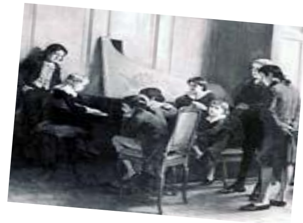
Первые концерты композитора в детстве