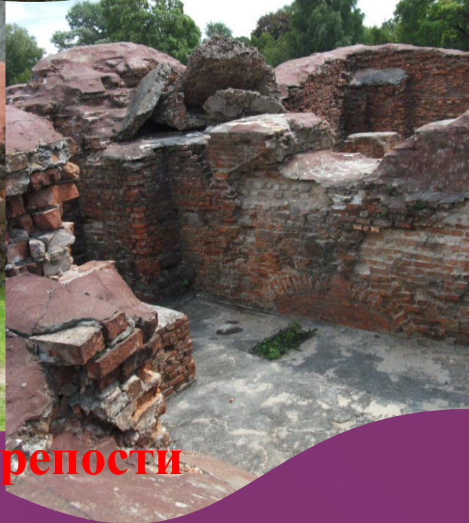
Говорящие камни Брестской крепости