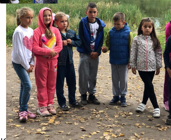
Команды внимательно слушают правила