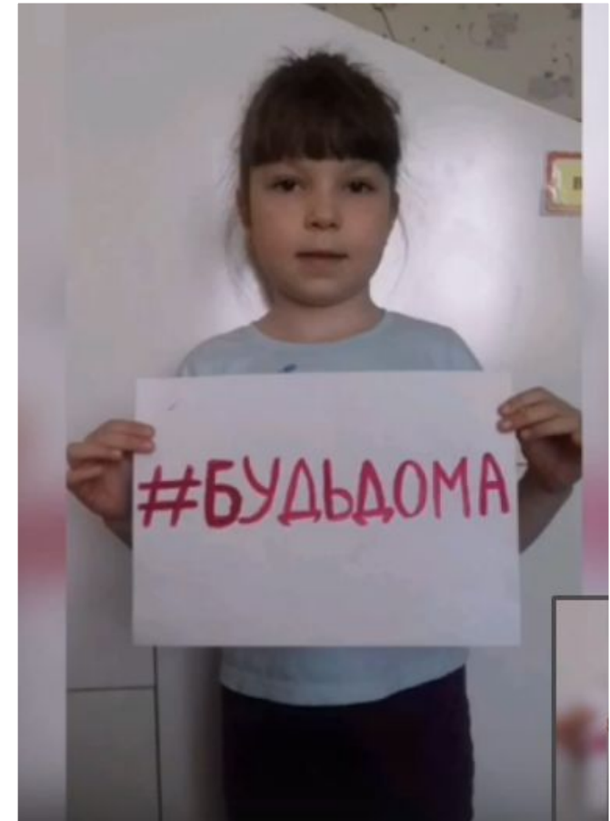
Скриншот из нашего жизнеутверждающего флэшмоба на самоизоляции