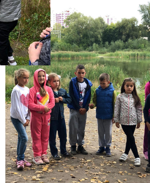
Команды внимательно слушают правила