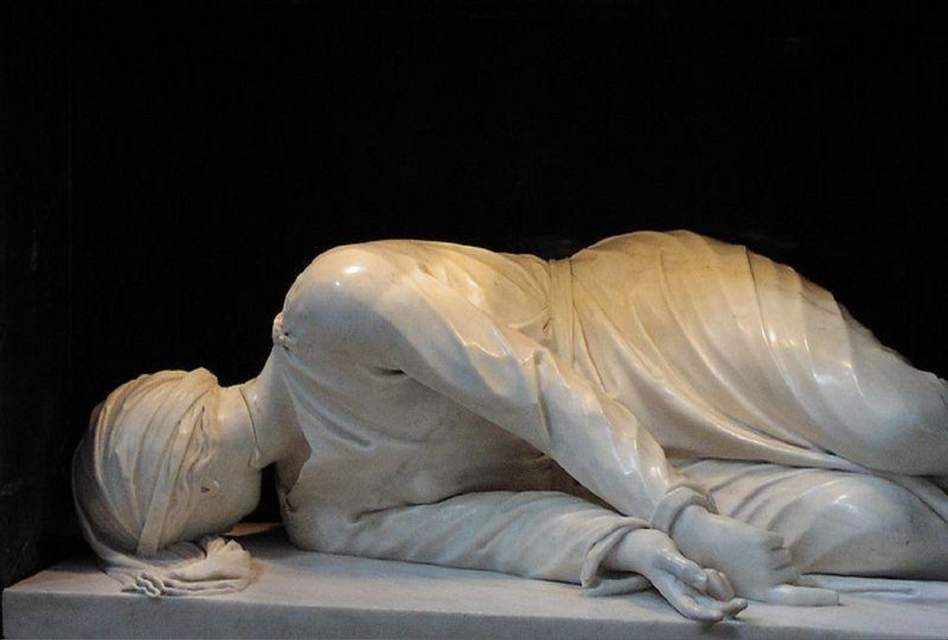
Мученичество святой Чечилии. Модерно