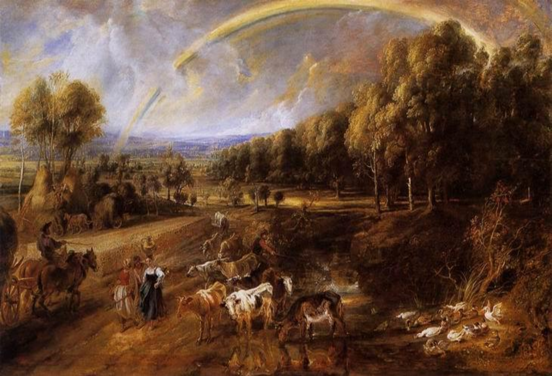
Пейзаж с радугой