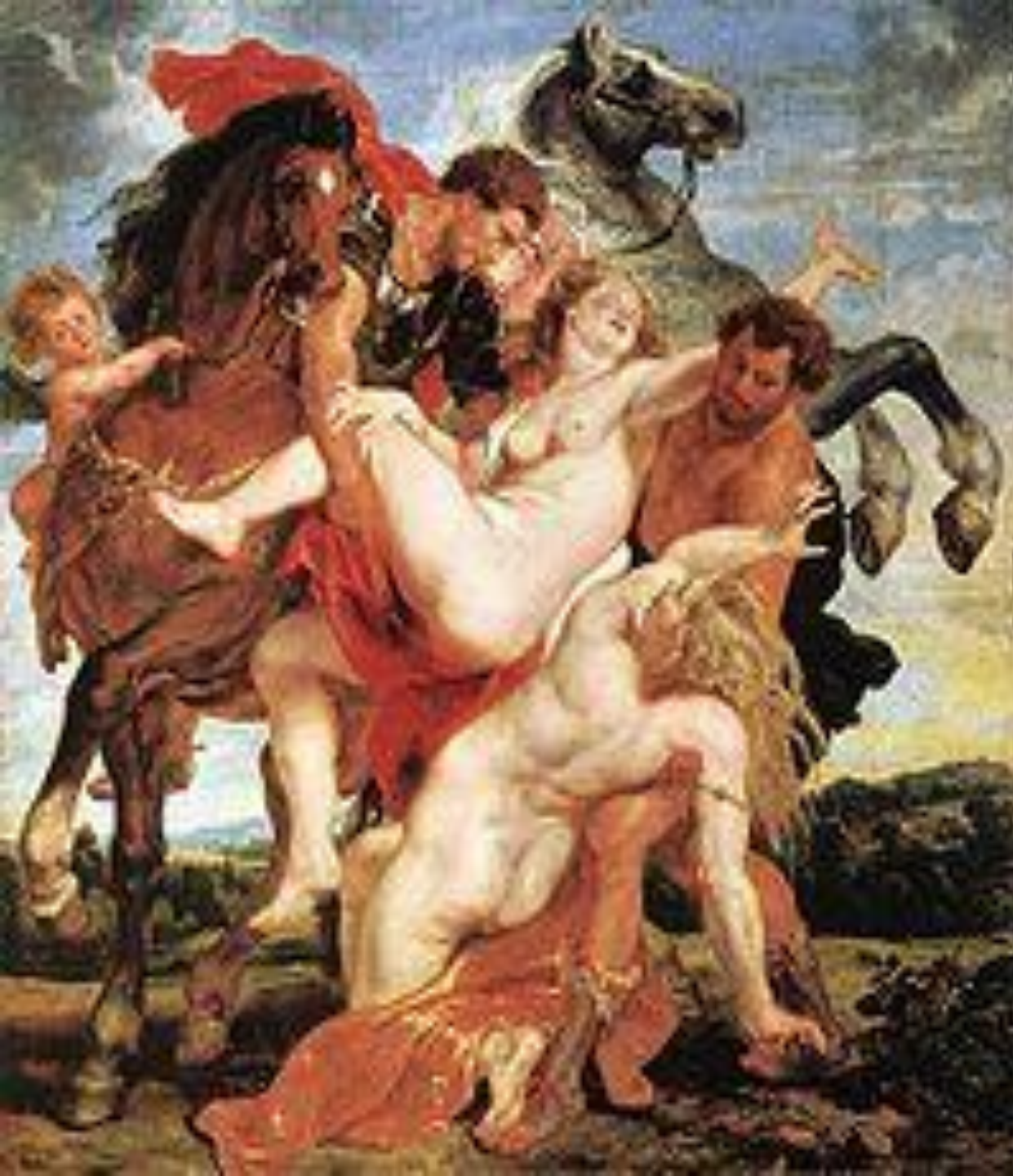
Похищение детей Левкиппа