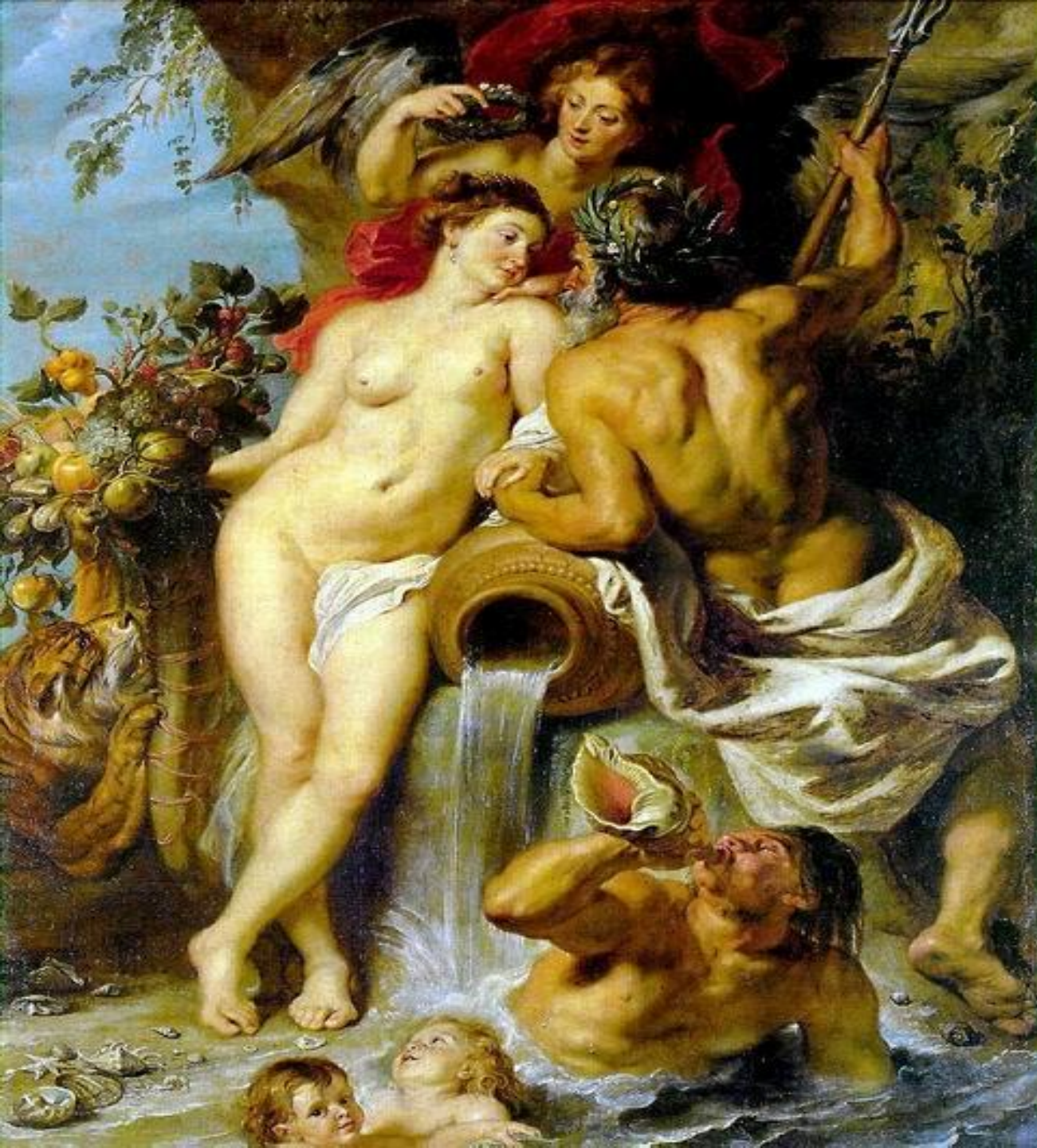
Союз Земли и Воды