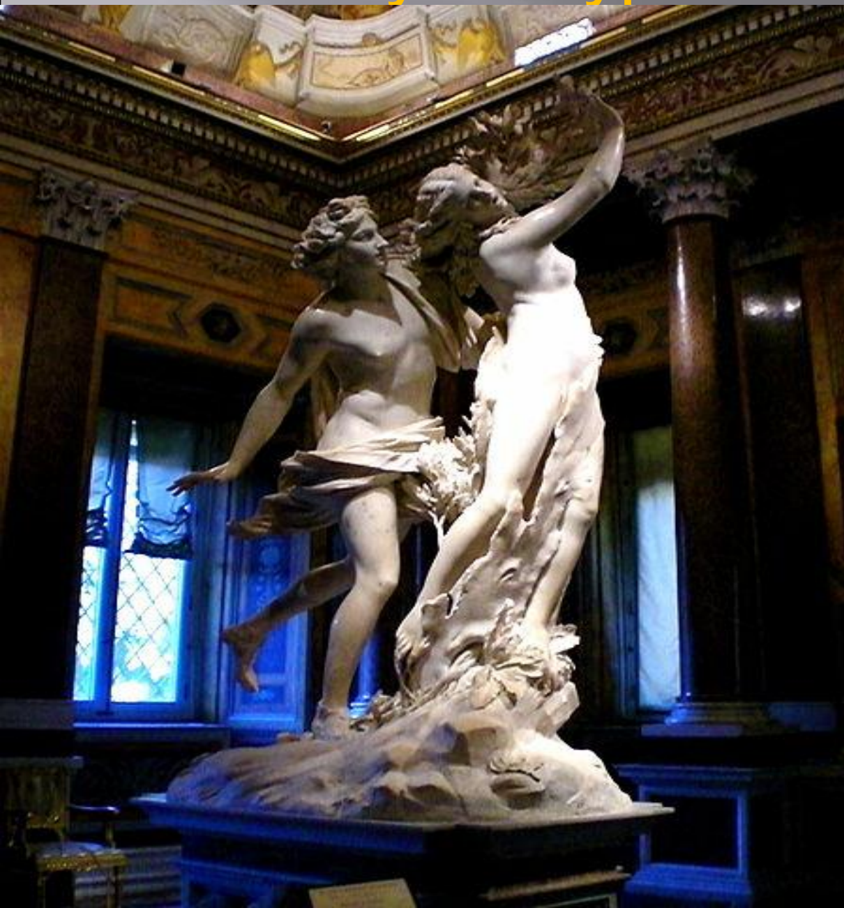
Аполлон и Дафна. Бернини