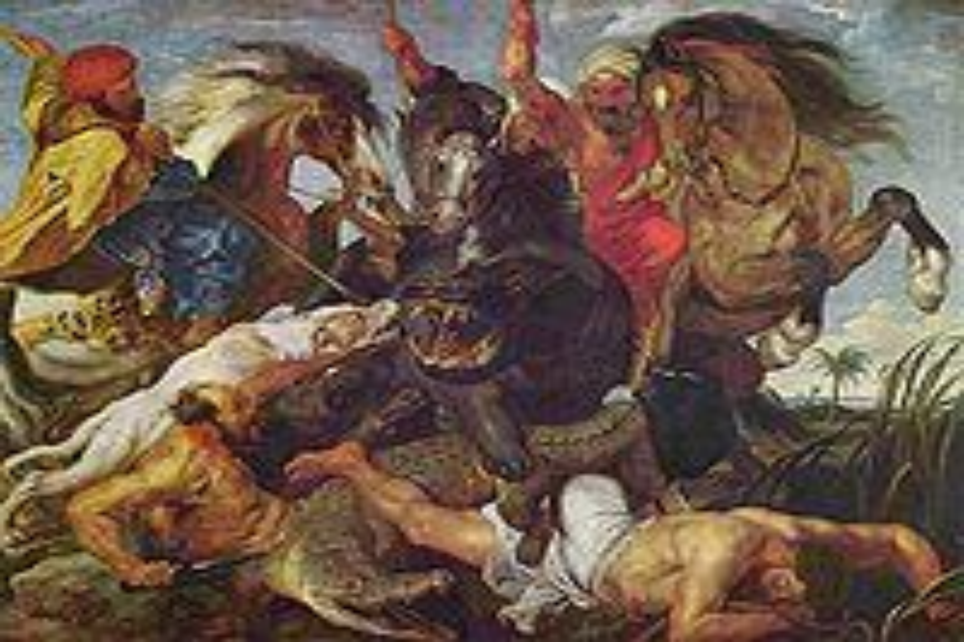
Охота на гиппопотама