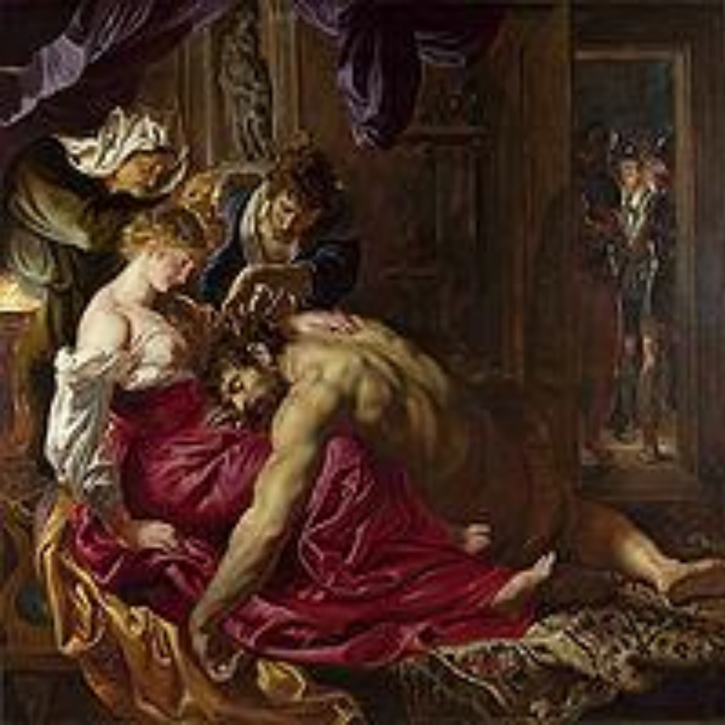
Самсон и Далила