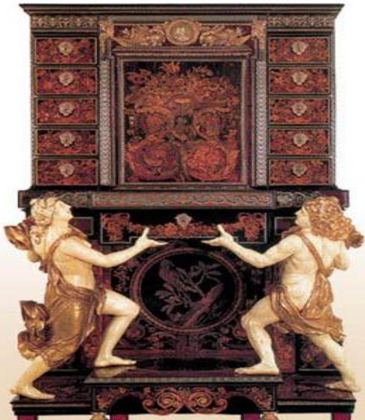
Секретер в стиле барокко