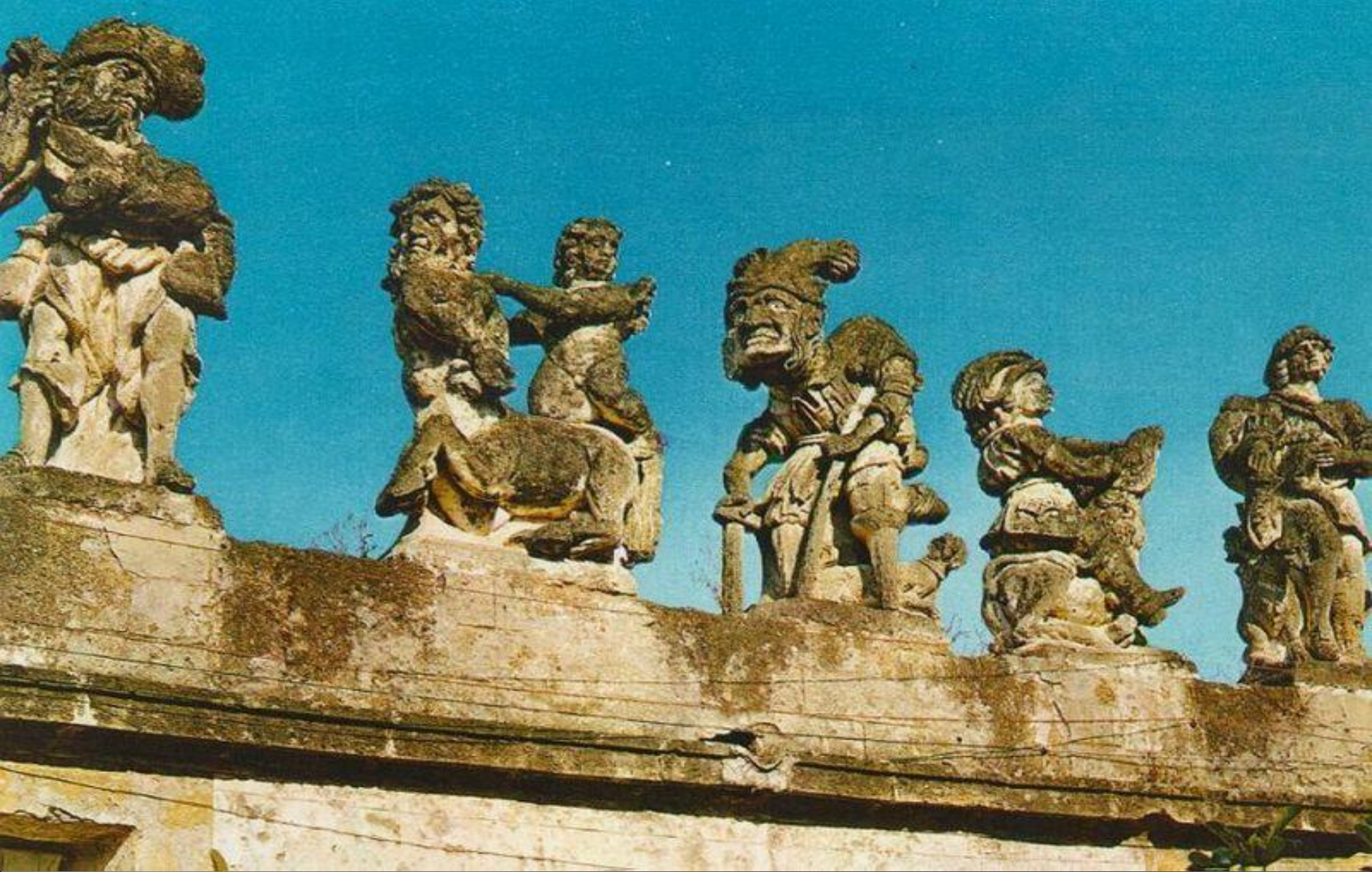
Вилла Палагония. Чудовища на крепостной стене. Италия