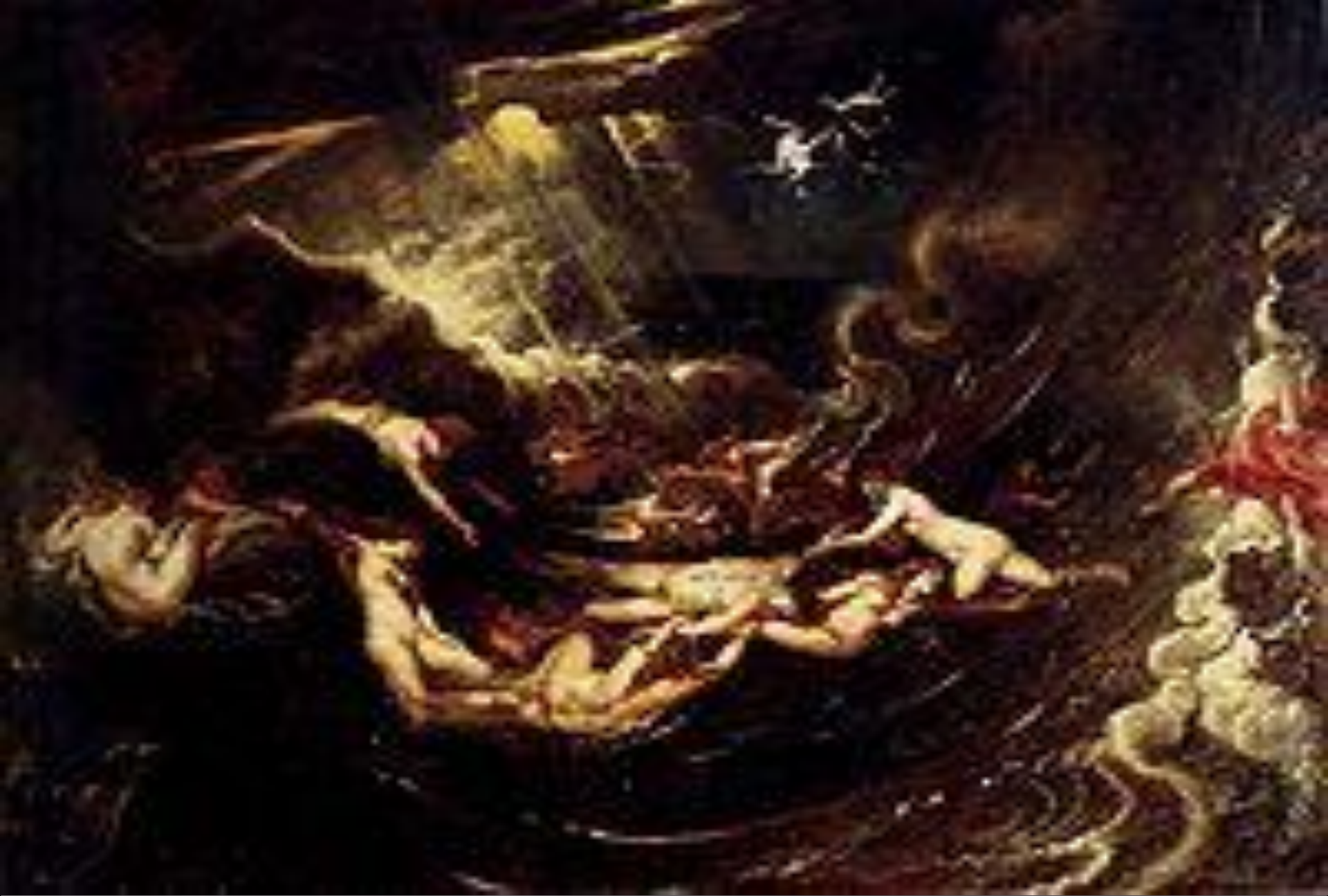
Геро и Леандр