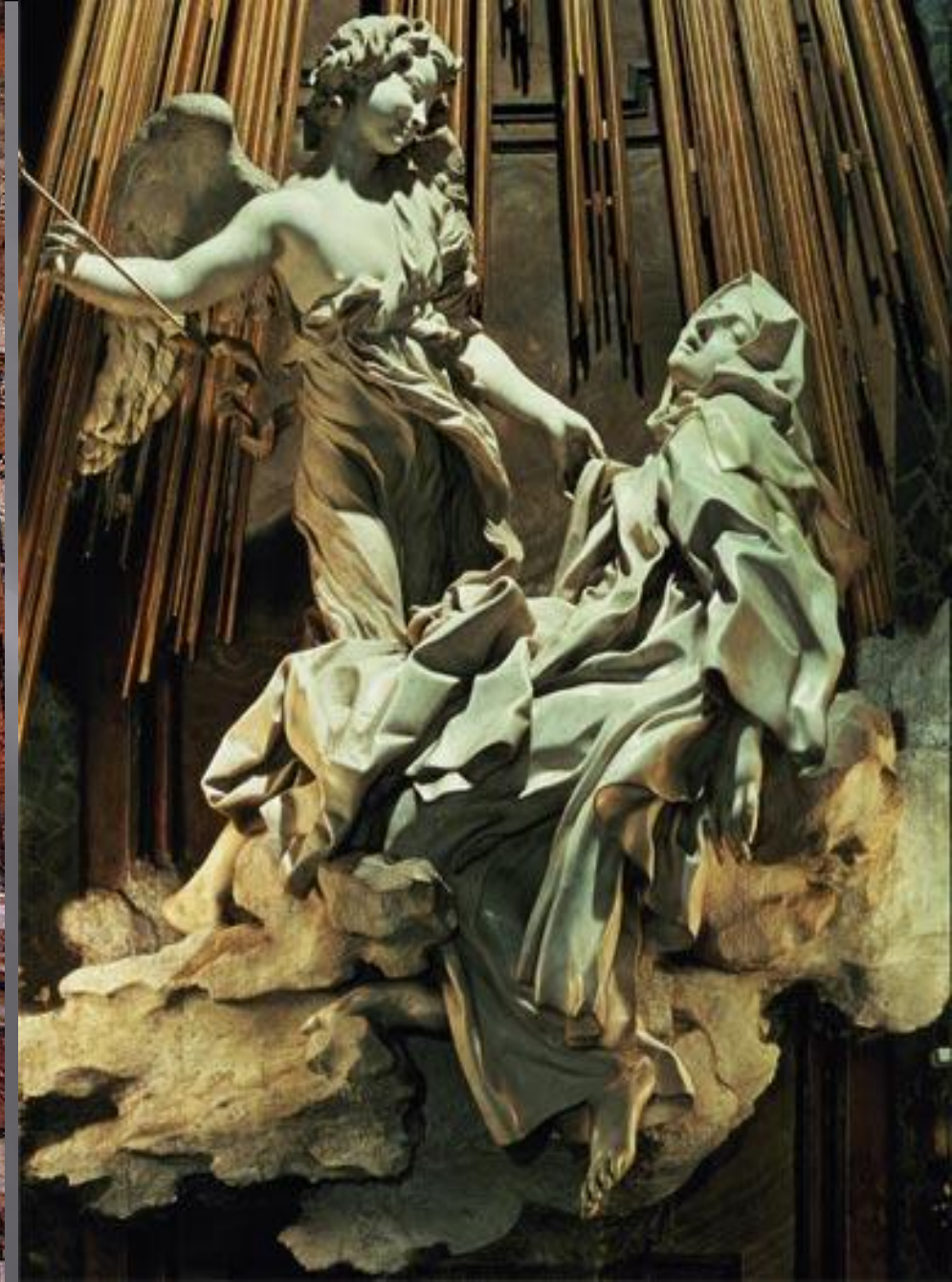
Экстаз Святой Терезы. Бернини