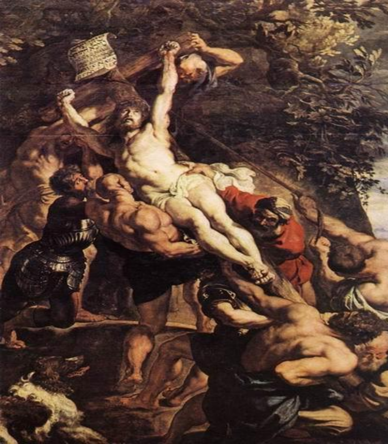
Воздвижение распятого Христа