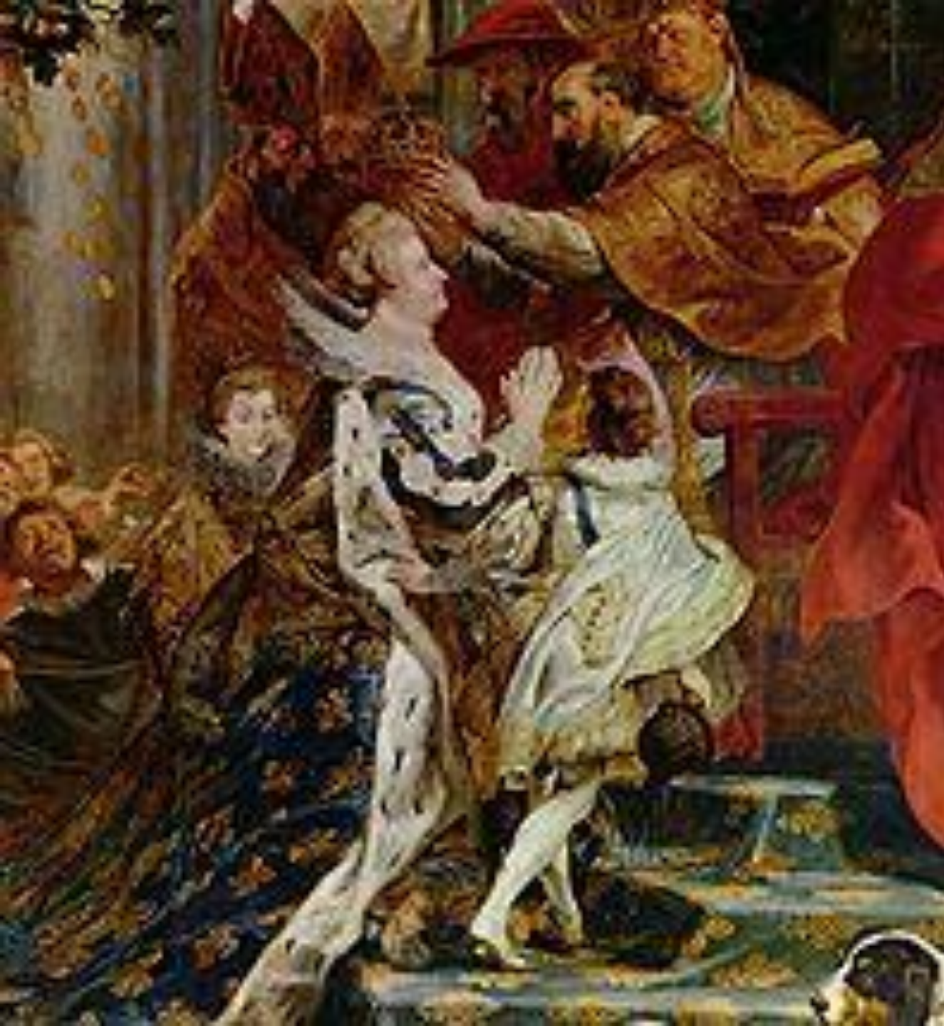
Коронация Марии Медичи