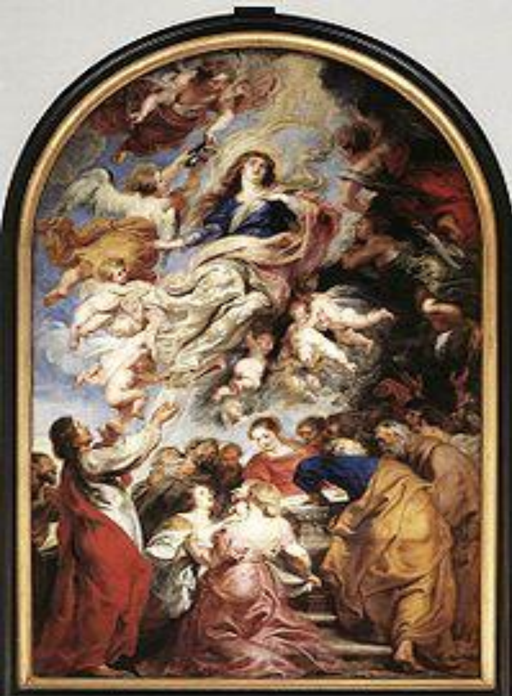
Успение Пресвятой Девы Марии