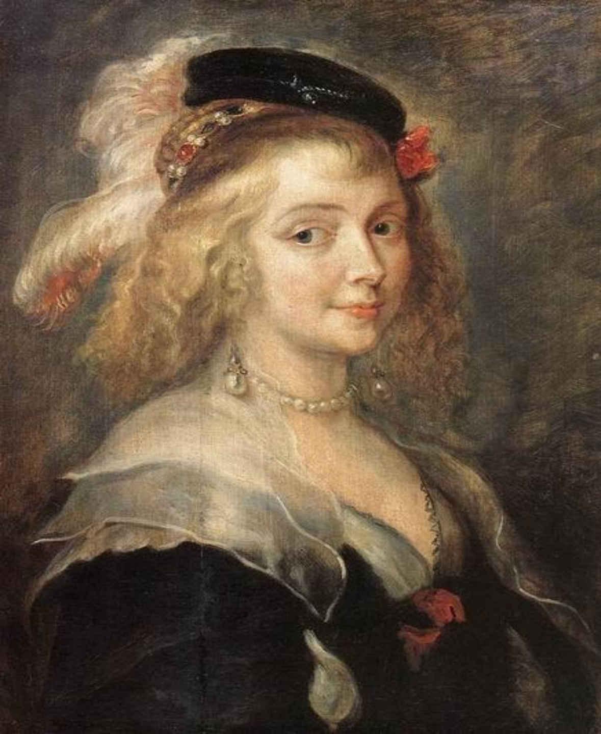
Елена Фоурмен 2-я жена Рубенса