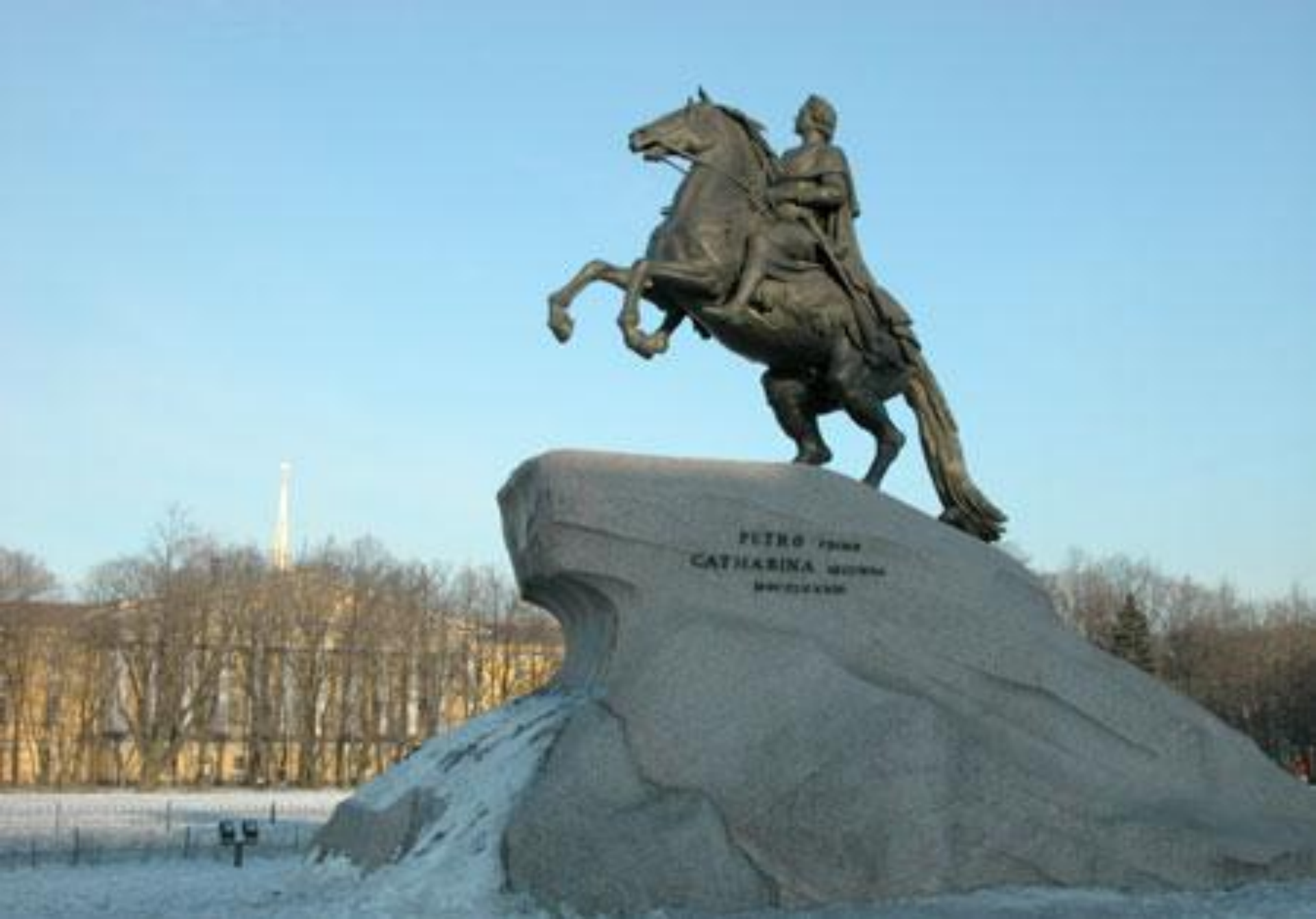
Памятник Петру Первому