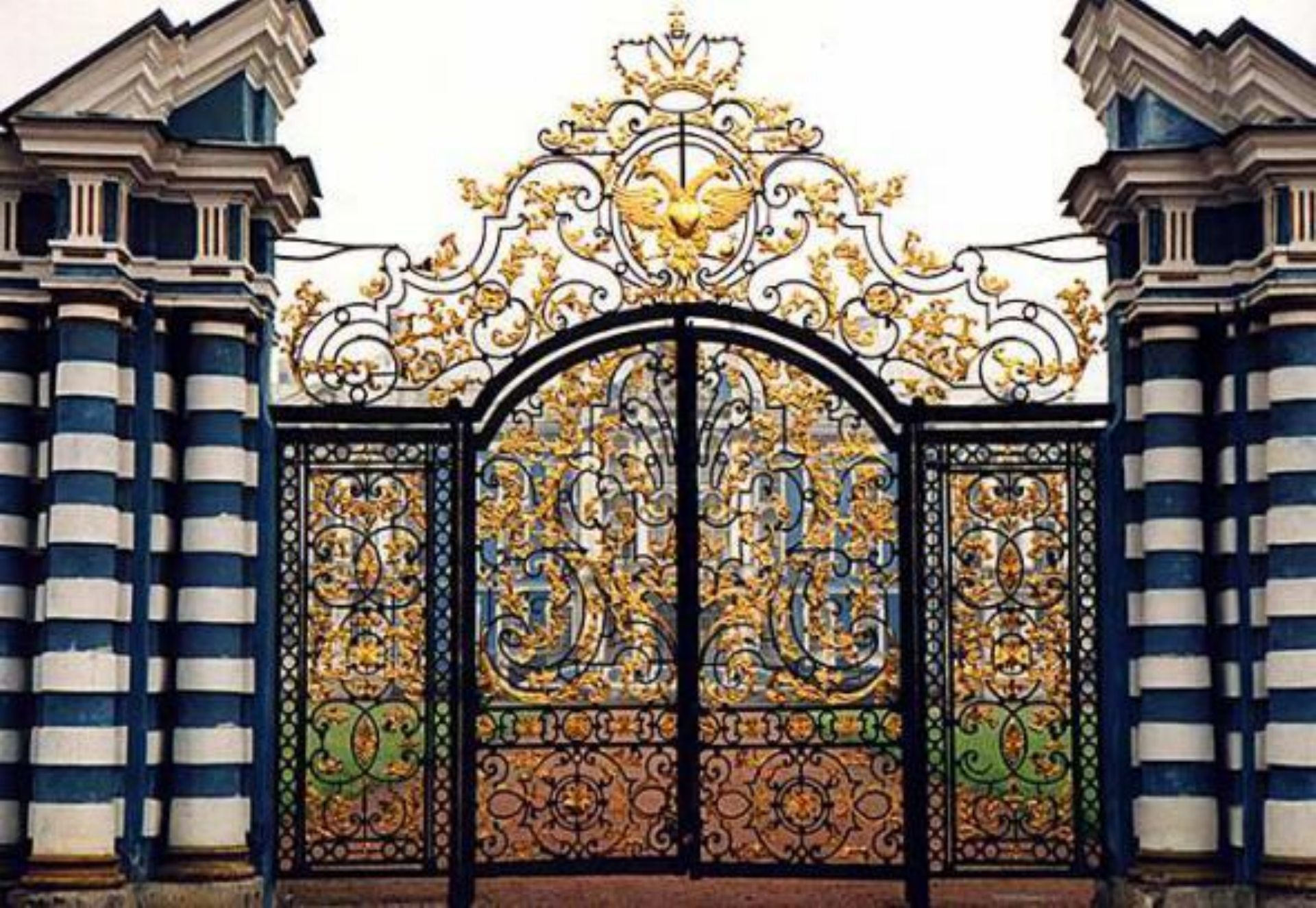
Парадный вход в Екатерининский дворец. Растрелли