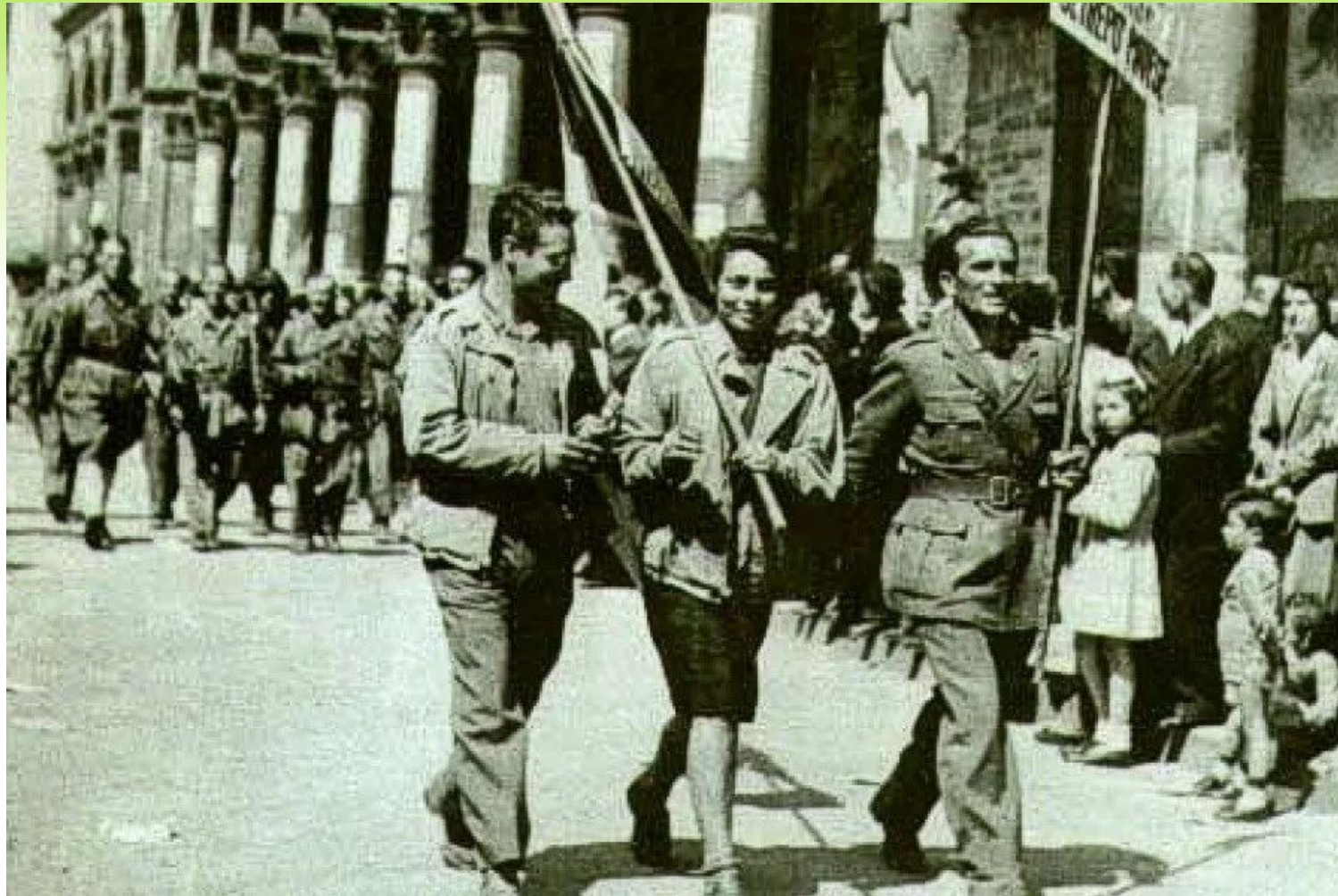
Партизаны, Италия 1945г

Формы и способы вооруженной борьбы участников Сопротивления зависели от особенностей социально-политического положения в стране, наличия подготовленных военных кадров и вооружения.