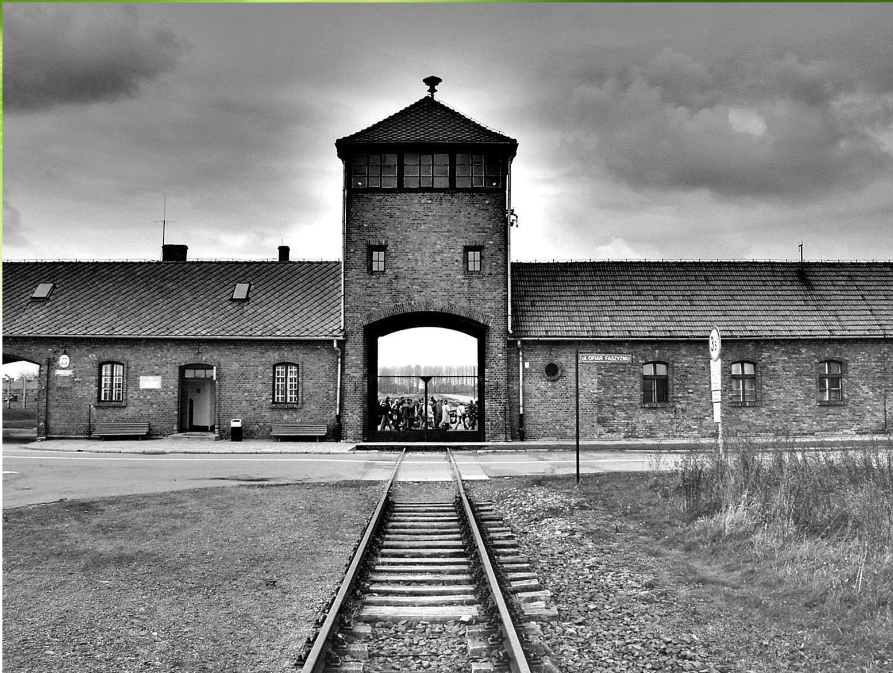
Самым крупным из лагерей уничтожения являлся Освенцим , около города Кракова.