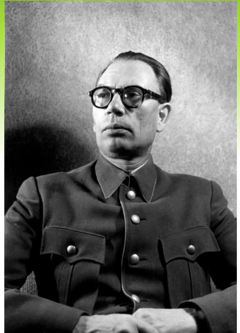
Андрей Андреевич Власов

Испытывая острый недостаток в живой силе, немецкое командование увеличило количество вспомогательных воинских частей, сформированных из советских военнопленных и жителей оккупированных областей. Помимо ранее существовавших национальных «легионов», оно приступило к организации, так называемой Русской освободительной армии (РОА), во главе которой поставили бывшего командующего советской 2-й ударной армией генерал-лейтенанта Власова. Летом 1942 г. его армия попала в окружение, Власов был взят в плен и перешел на сторону Германии.