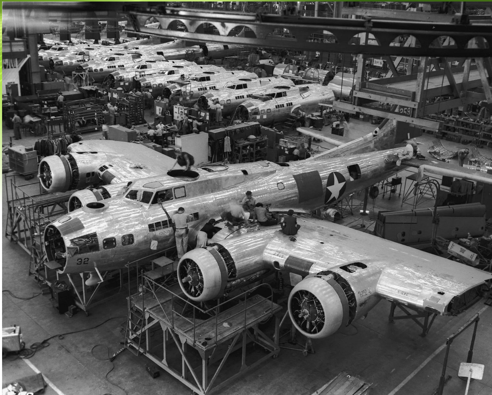
Место съемки: Бербанк, Калифорния,