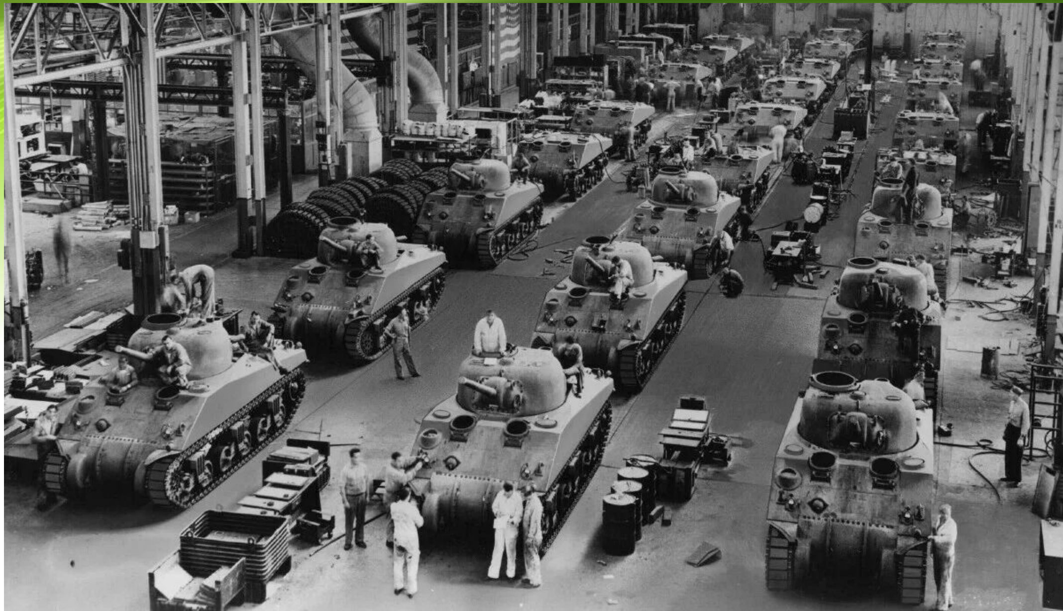
Танковый завод Детройтский Арсенал