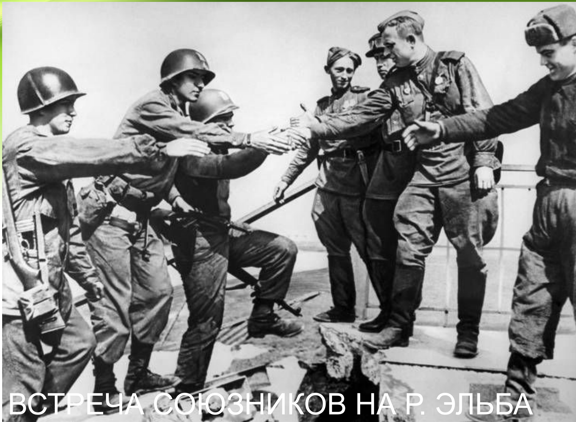
ВСТРЕЧА СОЮЗНИКОВ НА Р. ЭЛЬБА