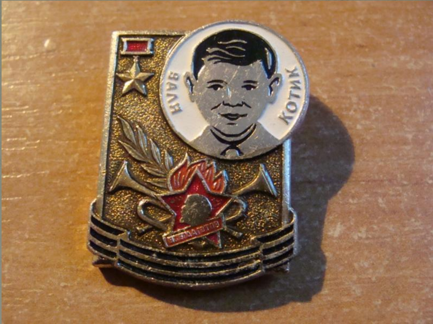
Одна из наград Вали Котика