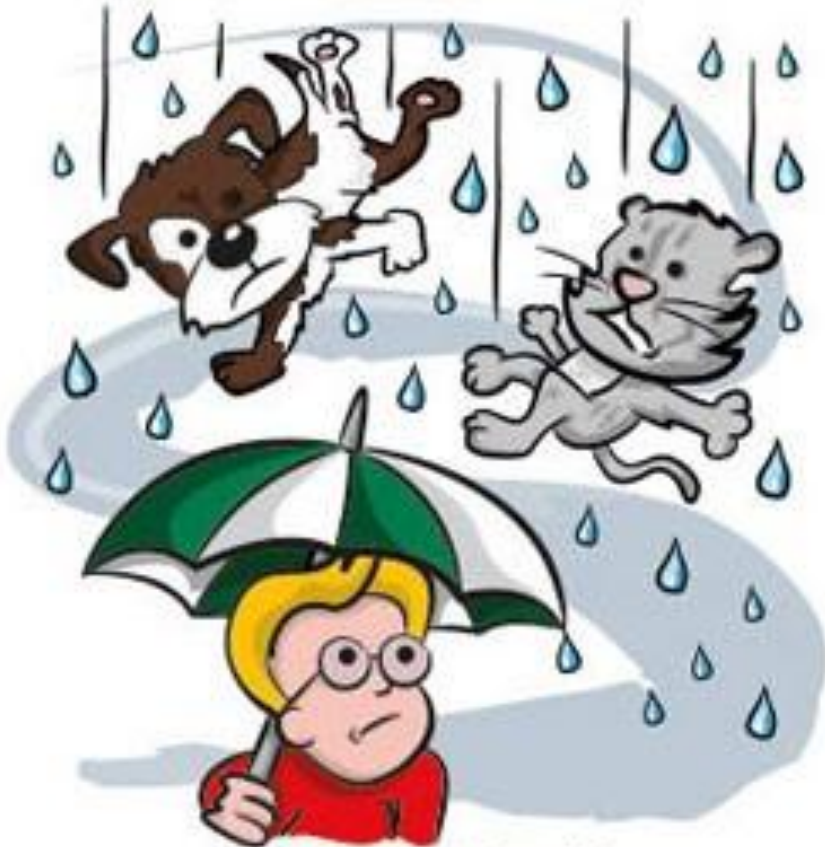
Raining cats and dogs