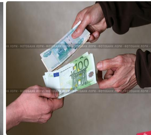
Обмен деньгами