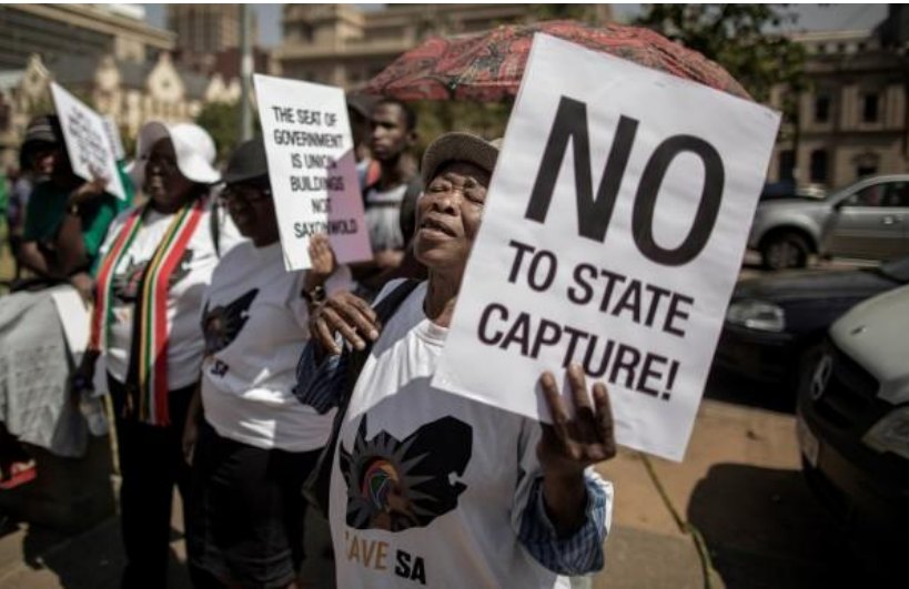
TI – South Africa (“Corruption Watch”)