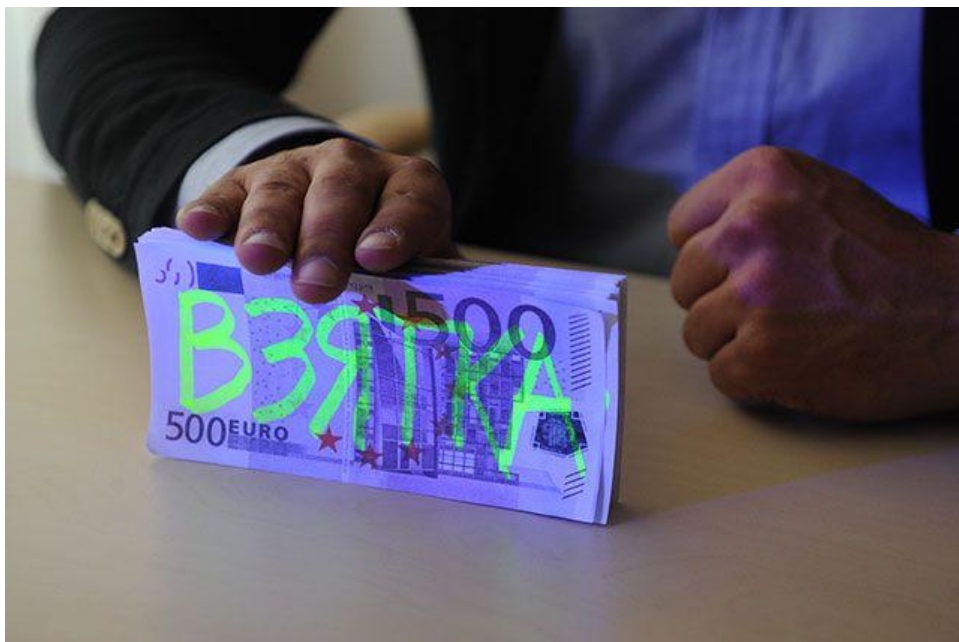
Любимая купюра коррупционеров