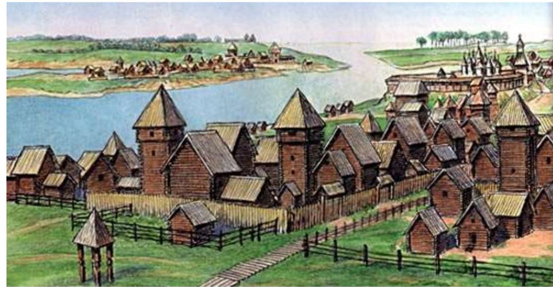
Древнерусское государство – Киевская Русь (IX – нач. XII вв.)