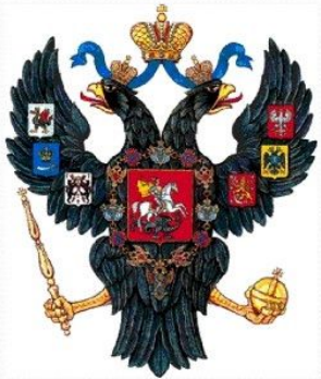
Герб Российской империи

В 1721г. Петр I получил титул императора. Россия стала империей.