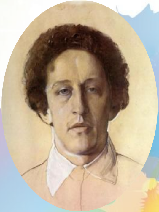
Александр Александрович Блок