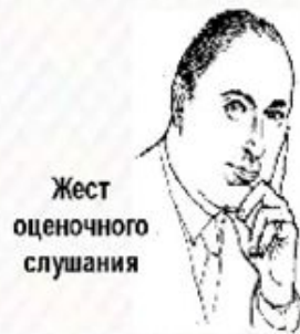
Жест оценочного слушания