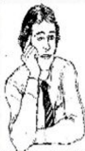
Жест оценочного слушания