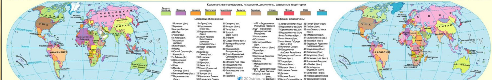
МИР в 1961 г.