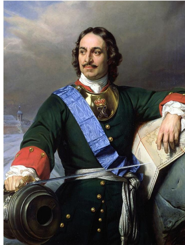
Первый Император Всероссийский Романов Пётр I Алексеевич