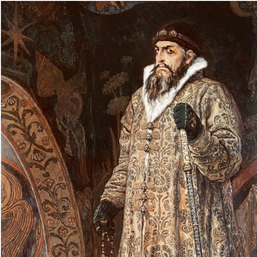
Царь Иоанн Васильевич Грозный

Император – правитель империи, которая состоит из территорий нескольких государств, ранее обладающих независимостью и объединенных вследствие завоевания.