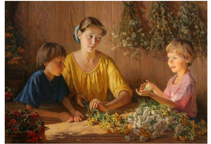
М.Чулович. Дары уходящего лета

Ты слабеешь -в меня уходят силы твоя. Ты стареешь -в меня уходят годы твои. Все равно, несмотря на любые года, Будешь ты для меня молодой навсегда.