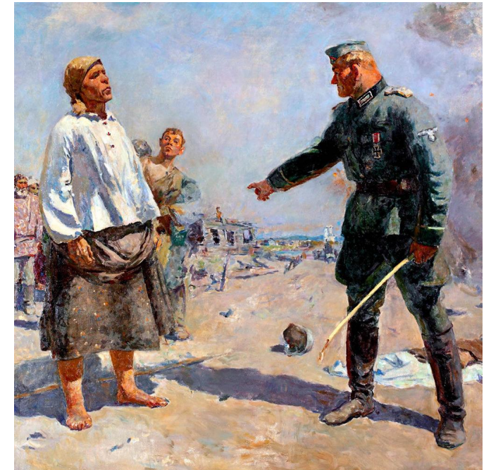
С.В. Герасимов. Мать партизана

Отечественной В страшные годы Великой Отечественной войны матери мужественно носили бремя тяжелого труда в тылу, вставали плечом к плечу вместе с мужьями и сыновьями на фронте, в тылу врага помогали своим детям - подпольщикам. В повести «Улица младшего сына» мы узнаём о роли матери в воспитании пионера-героя Володи Дубинина (Владимира Никифоровича Дуинина), партизана - защитника Аджимушкских каменоломен.