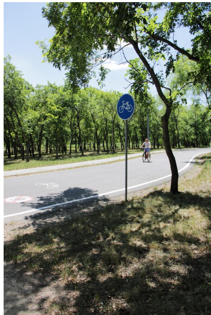
Фото.4 «Велосипедная дорожка»