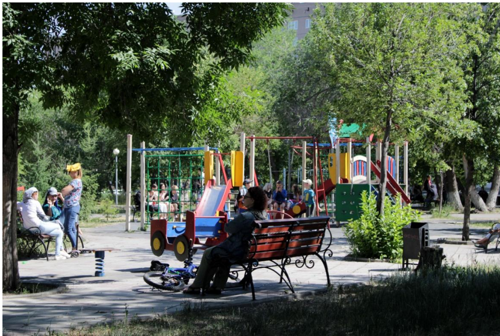
Фото.4 «Детская площадка»

Также на территории имеется большая детская площадка