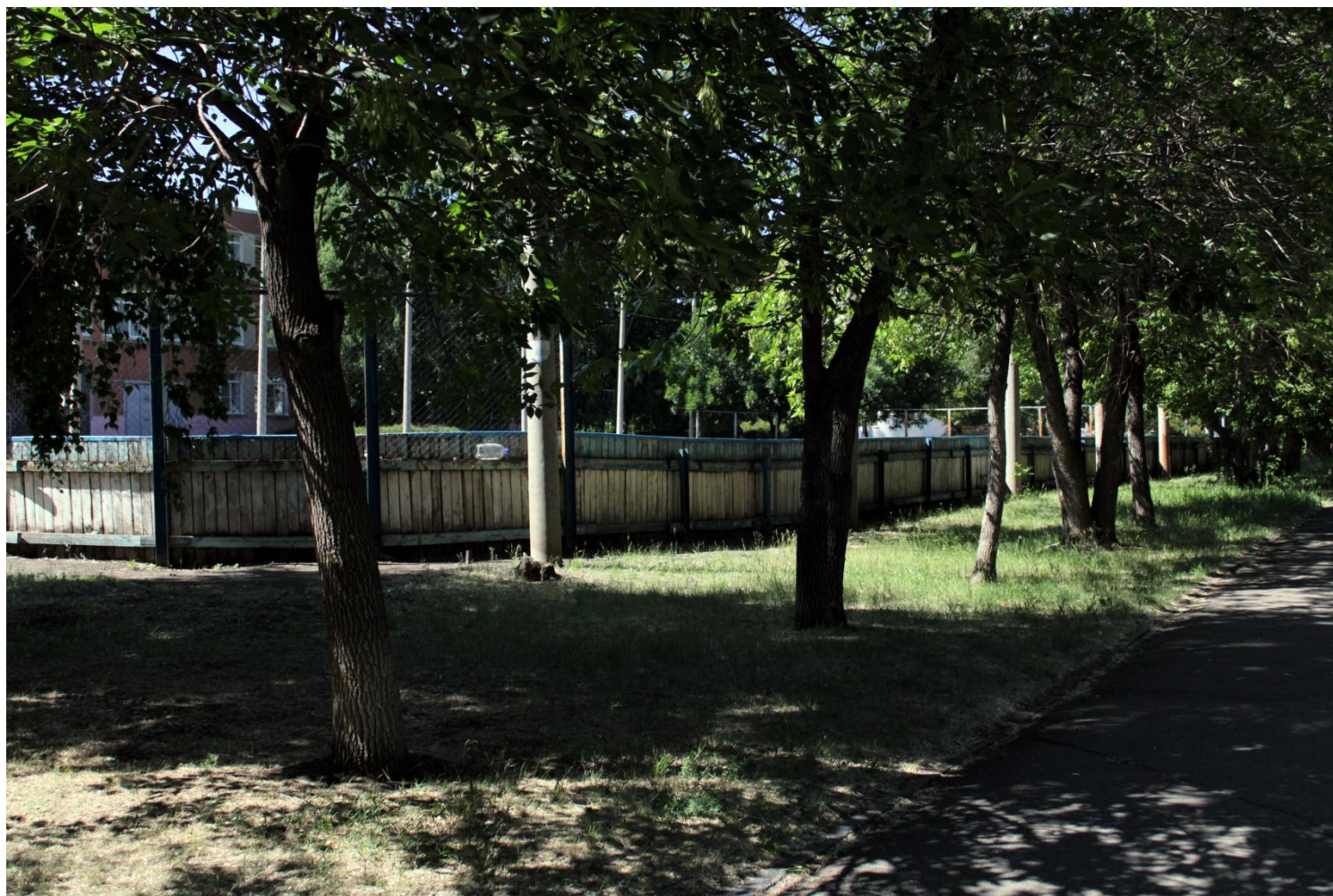
Фото.8 «Хоккейная коробка»

Плюсом ко всему – на территории сквера находится хоккейная коробка где зимой катаются на коньках и играют в хоккей, а летом здесь царит атмосфера футбола