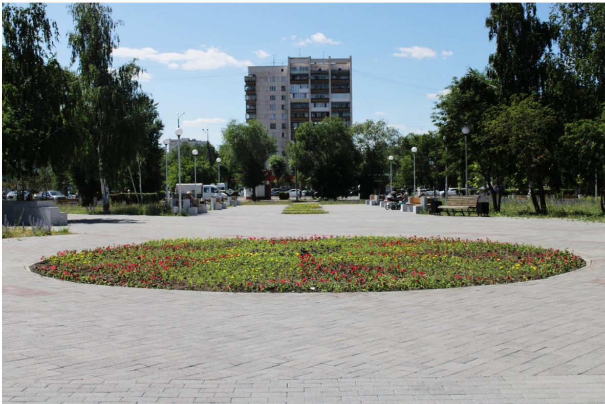
Фото.6 «Большая клумба»

Одна за другой там расположены несколько клумб с цветами, скамейки и большая клумба, служащая на новогодние каникулы площадкой для установки живой епи