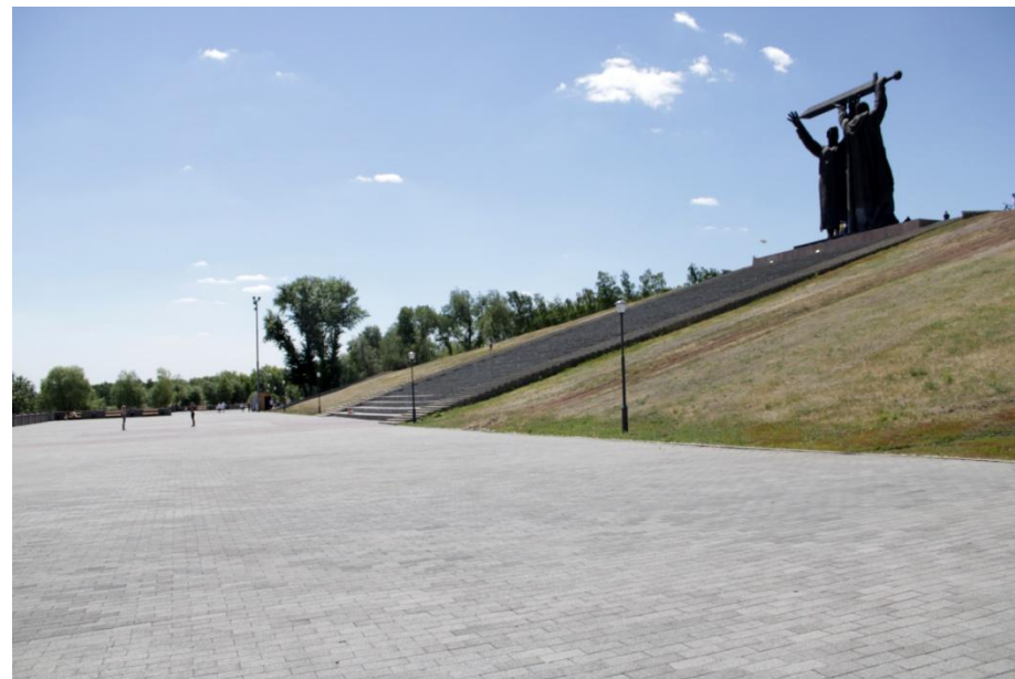
Фото.5 «Тыл- фронту»

В центре культурной зоны находится знаменитый памятник "Тыл- фронту".