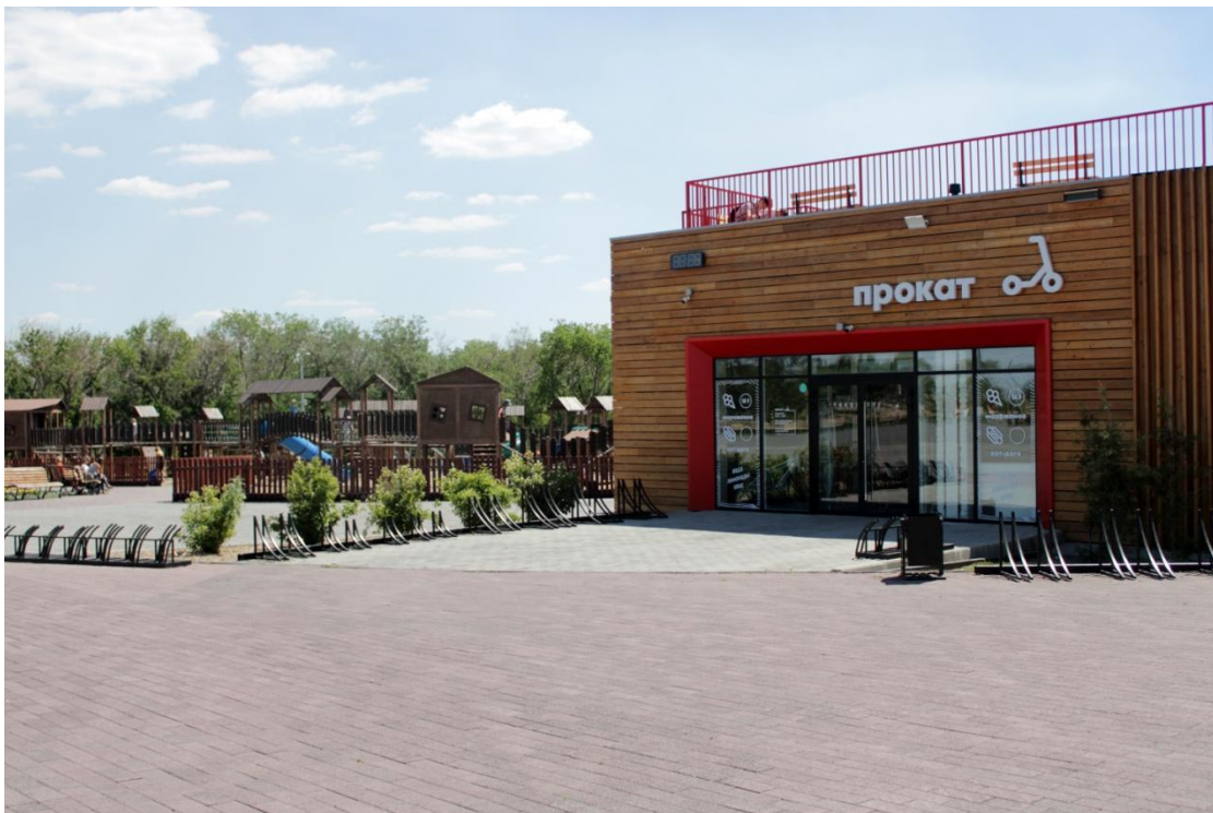
Фото.3 «Прокат» Так же обустроили спортивные зоны, дорожки для пешех прогулок и езды на велосипедах.