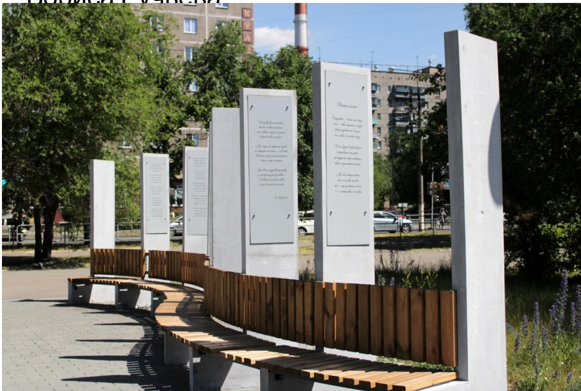
Фото.4 «Библио- скамейки»

На территории стоят необычные библио- скамейки и стенды с информацией о жизни Бориса Ручьёва