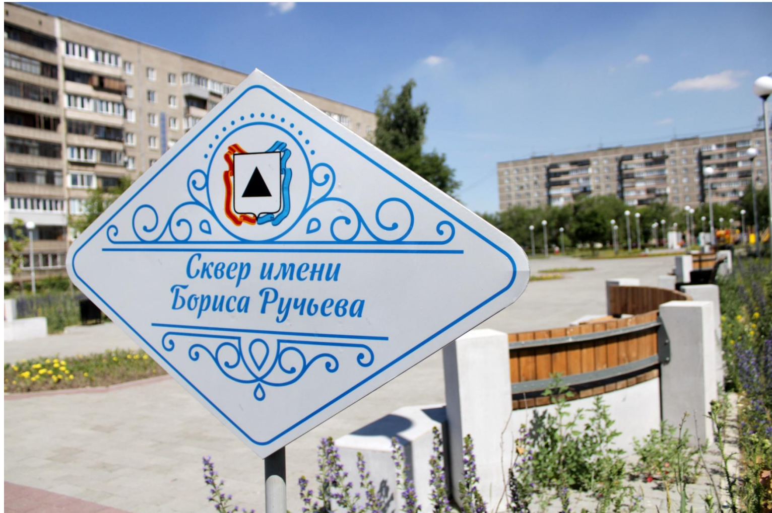
Фото.1 «Сквер имени Бориса