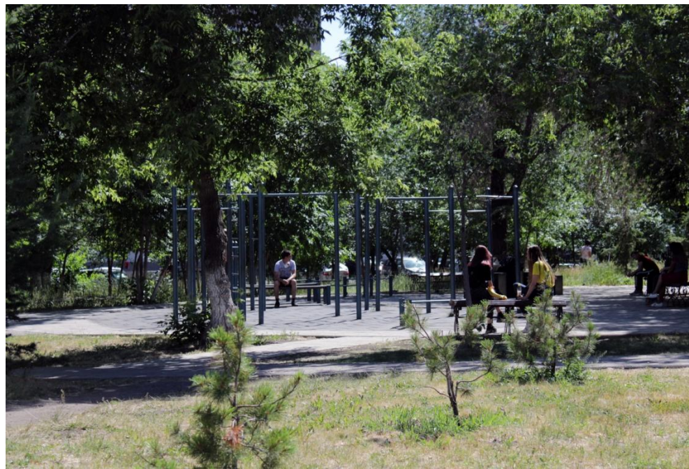
Фото.7 «Спортивный комплекс»

Все части парка связаны между собой широкими дорожками.