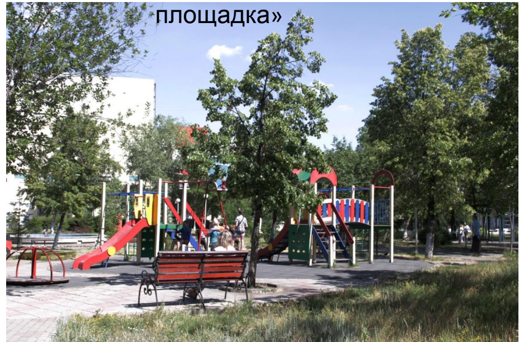
Фото.5 «Детская площадка»

Также на территории имеется большая детская площадка