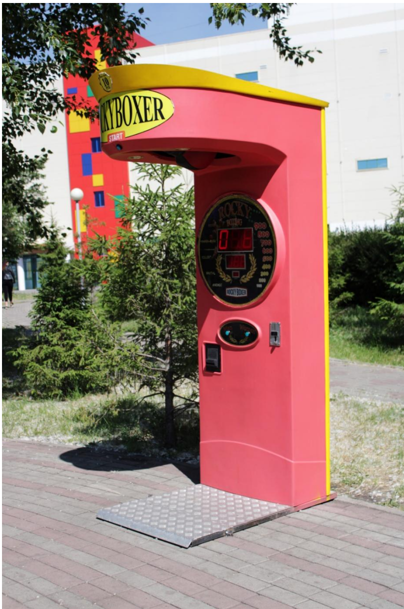
Фото.9 «Игровой аппарат» В сквере установлен

А летом тут продают мороженое и сахарную вату. Так что Вы и Ваш ребенок не останетесь равнодушными к Скверу «Магнит»