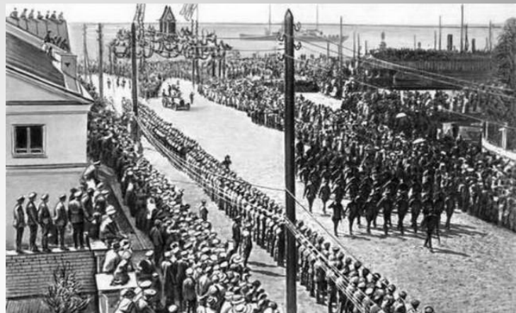
Английские войска в Архангельске