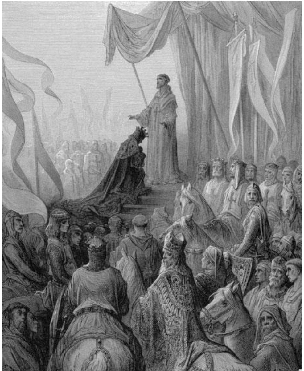
Святой Бернар проповедует Крестовый поход Людовику VII.