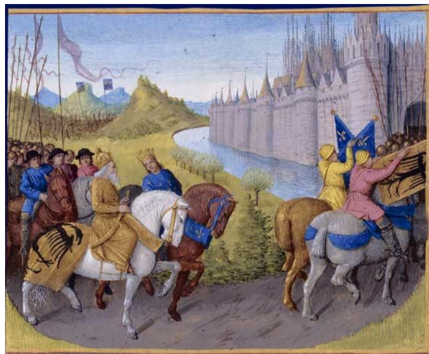
Arrivée des croisés à Constantinople.