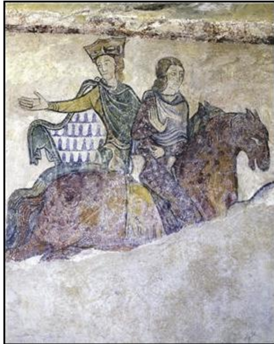
Королева Алиенора со своим младшим сыном, королем Джоном