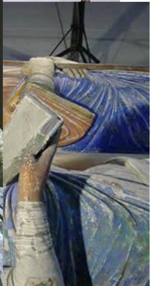
Надгробие Алиеноры Аквитанской