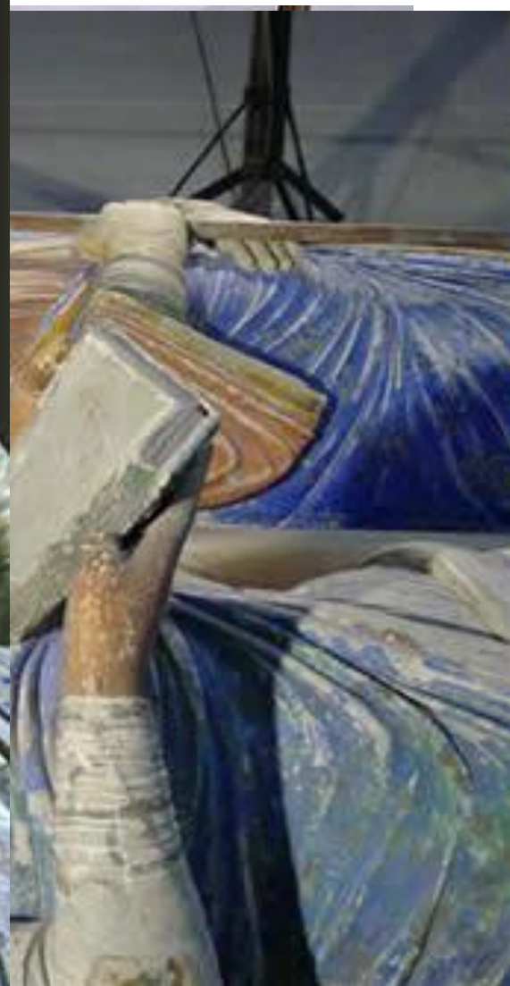
Надгробие Алиеноры Аквитанской