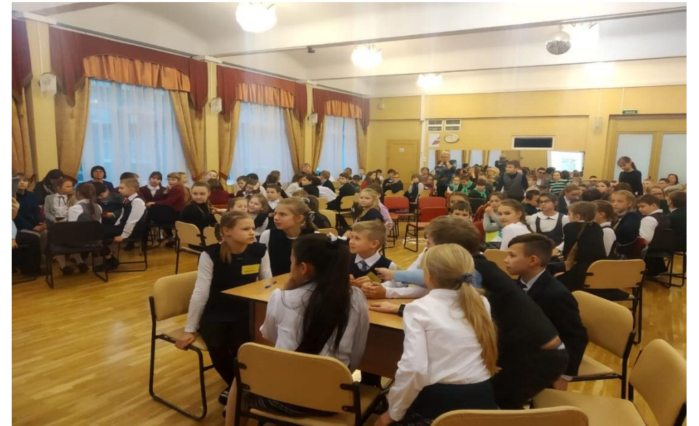
Фото с малой Олимпиады «Чудесный город»