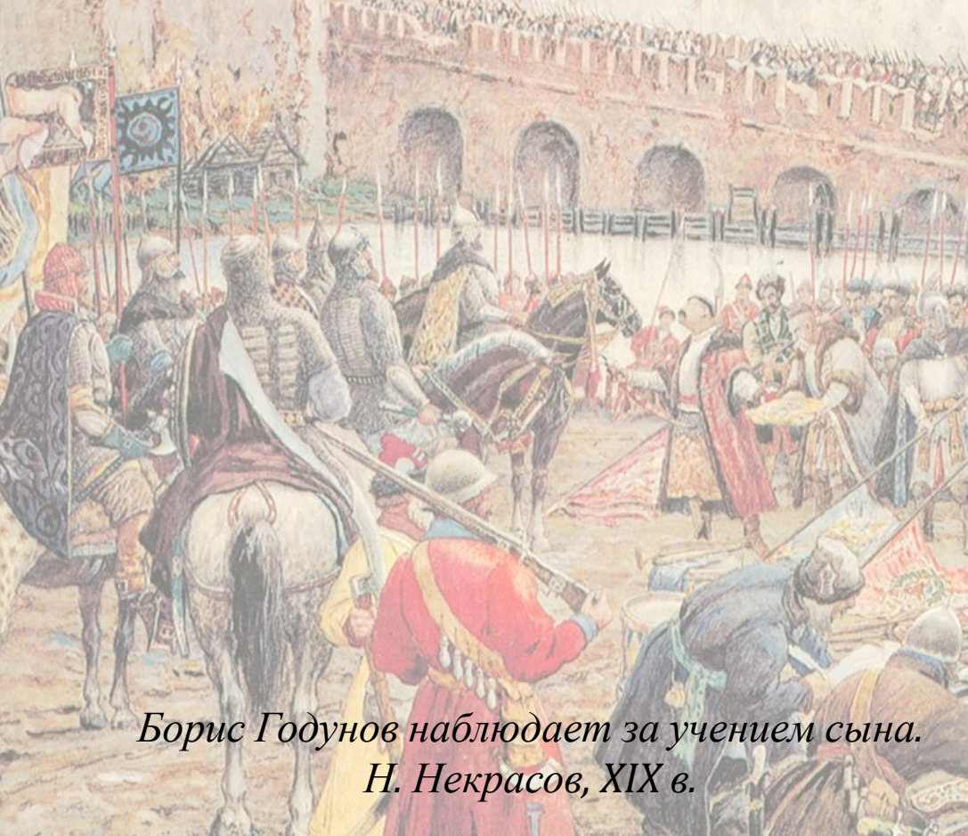
Борис Годунов наблюдает за учением сына. Н. Некрасов, XIX в.