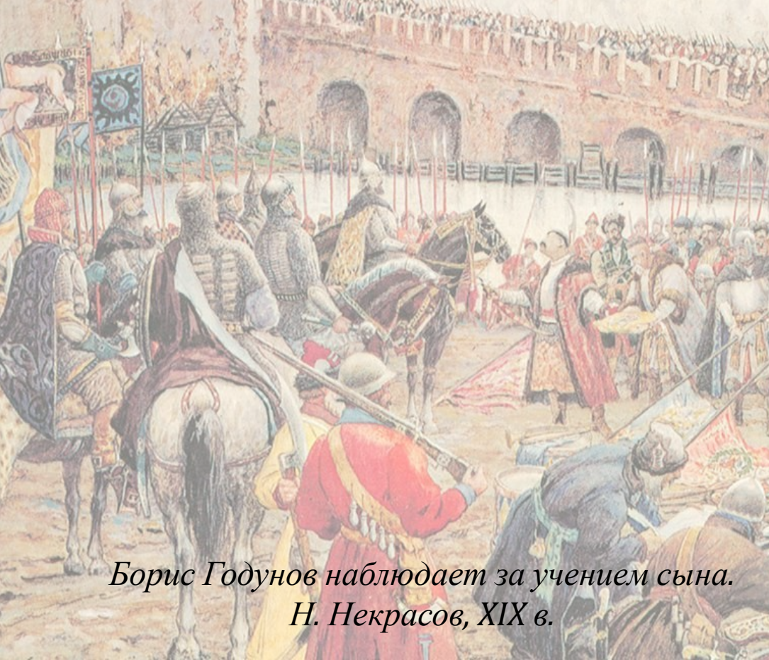
Борис Годунов наблюдает за учением сына. Н. Некрасов, XIX в.