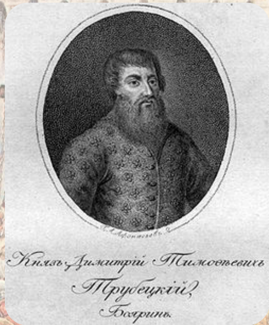
Князь Дмитрий Тимофеевич Трубецкой, Боярин.