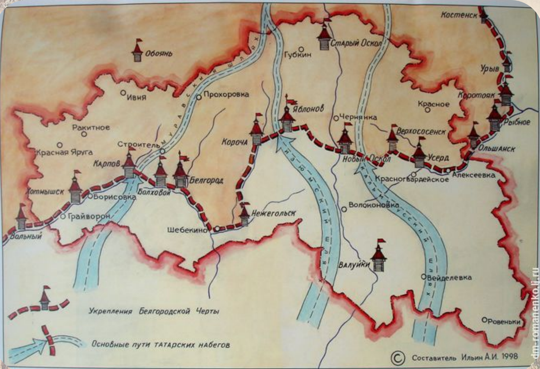
Белгородская засечная черта