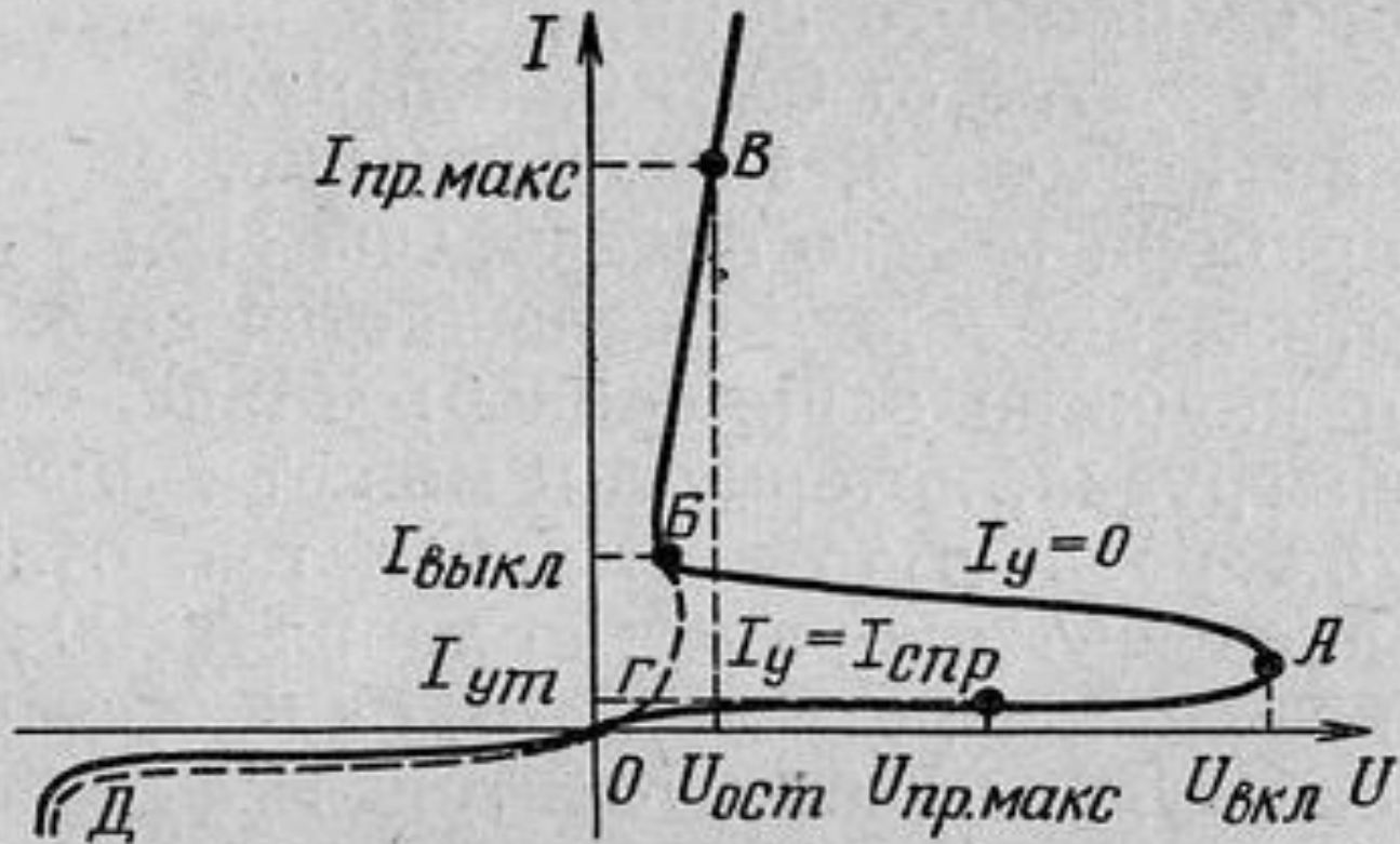
Рис. 1. Типовая вольтамперная характеристика тиристора